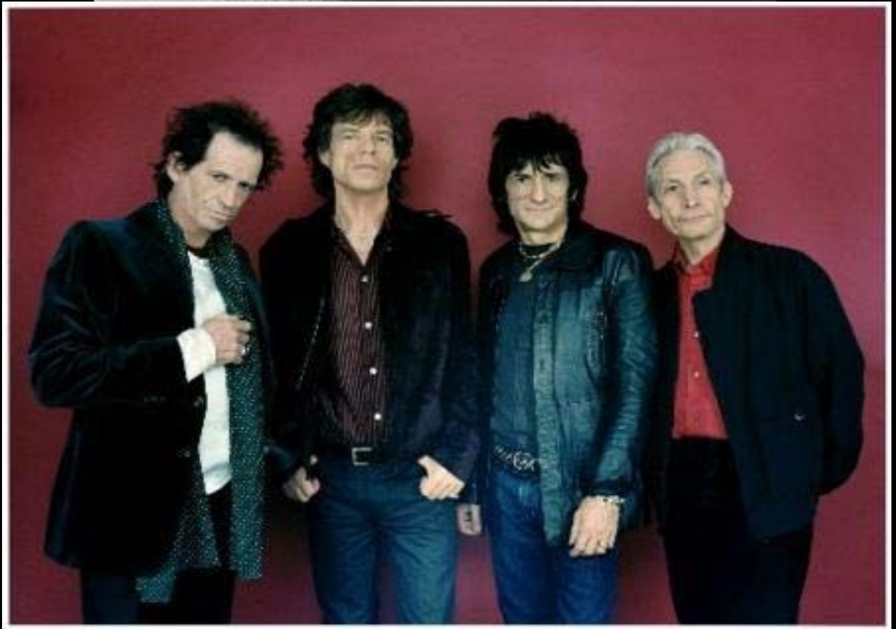
The Rolling Stones