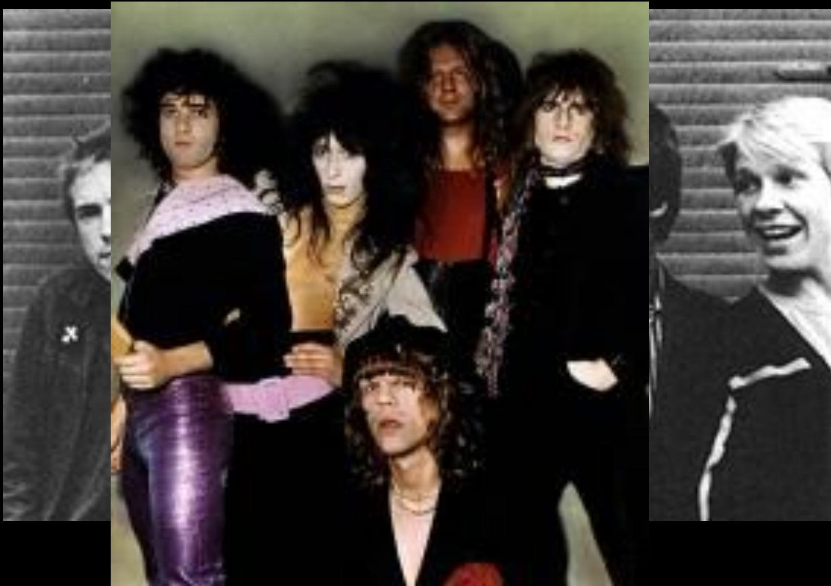
« New York Pistols»