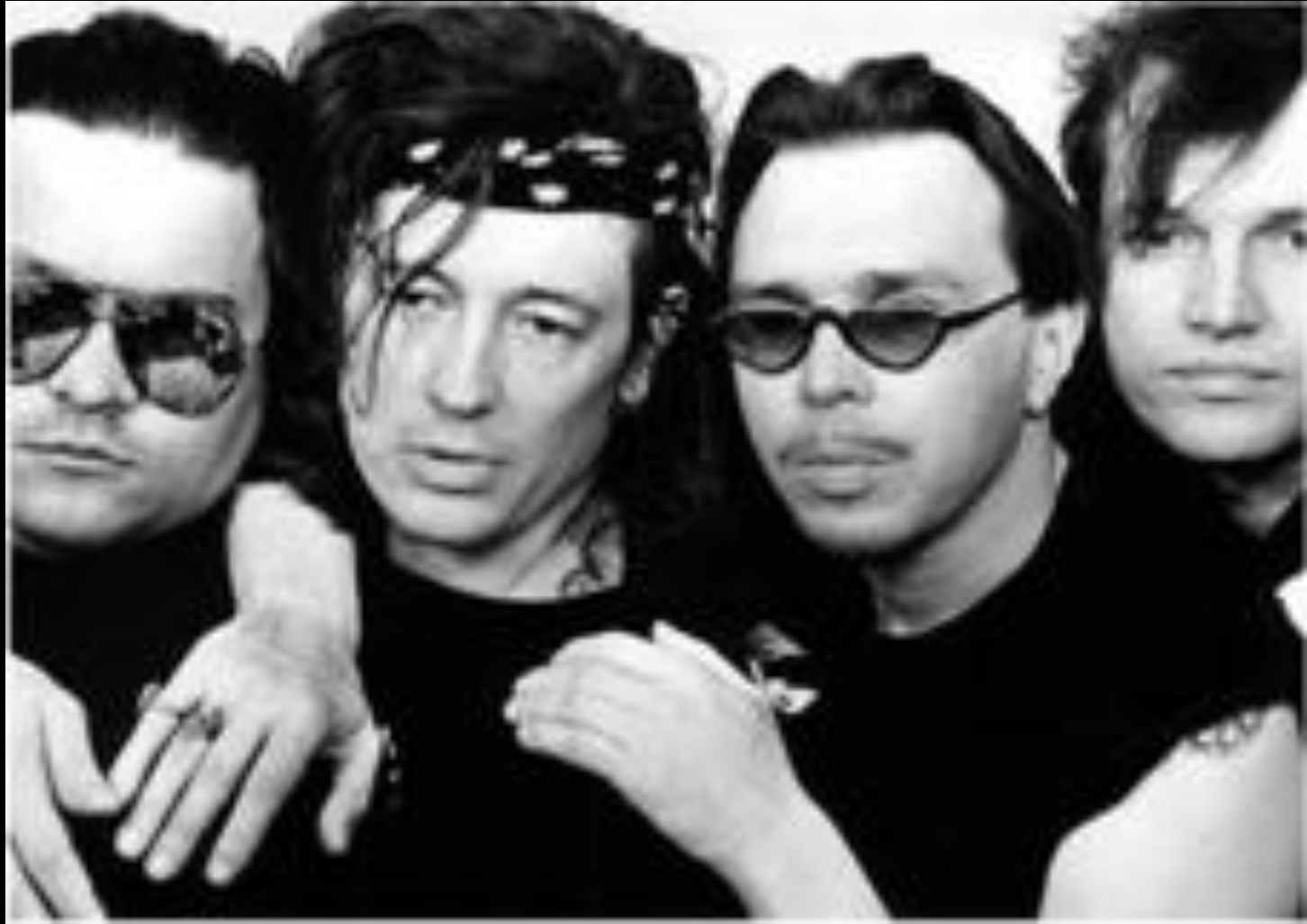
«Бригада С» (Гарик Сукачев)