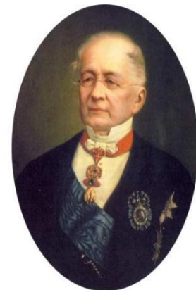
Министр иностранных дел России А.М.Горчаков