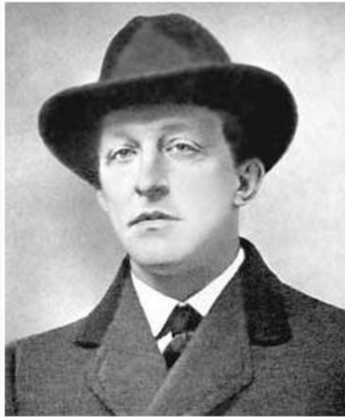
* Александр Александрович Блок 1880-1921