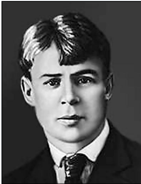
*Сергей Александрович Есенин 1895-1925