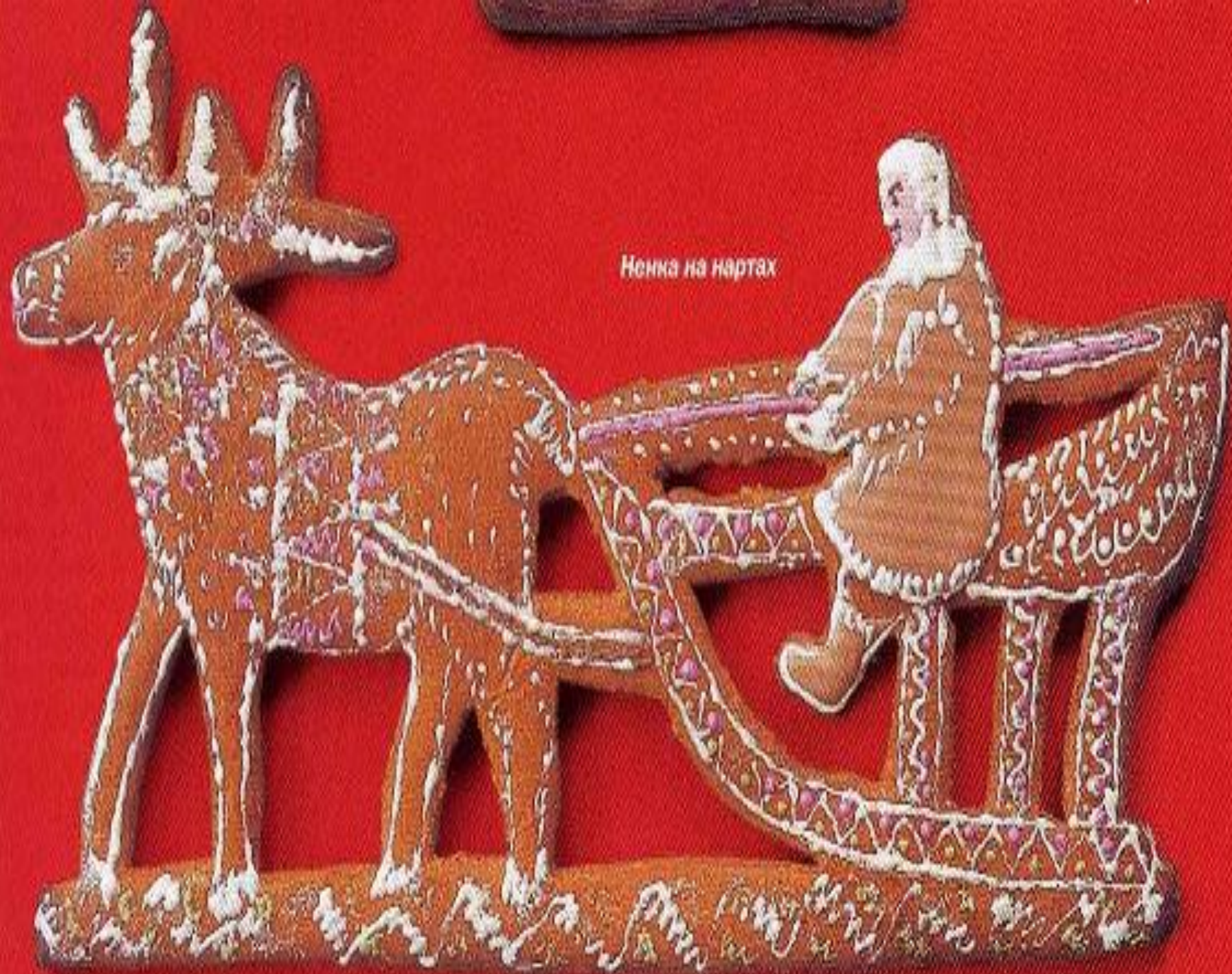
Ненка на нартах