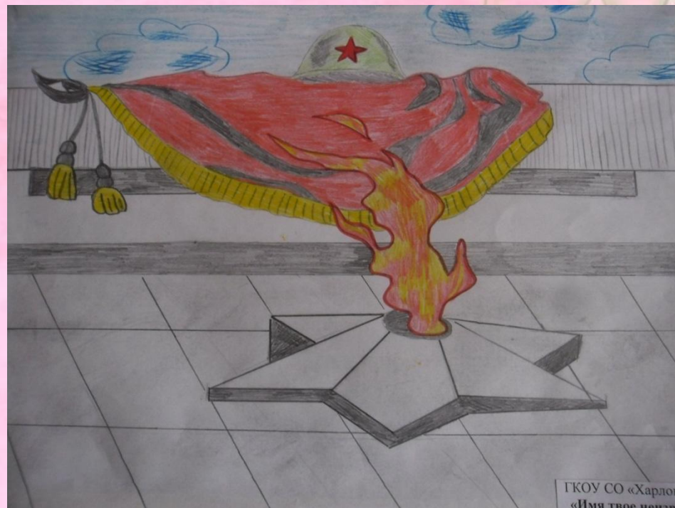
Рисунок воспитанницы 5 группы