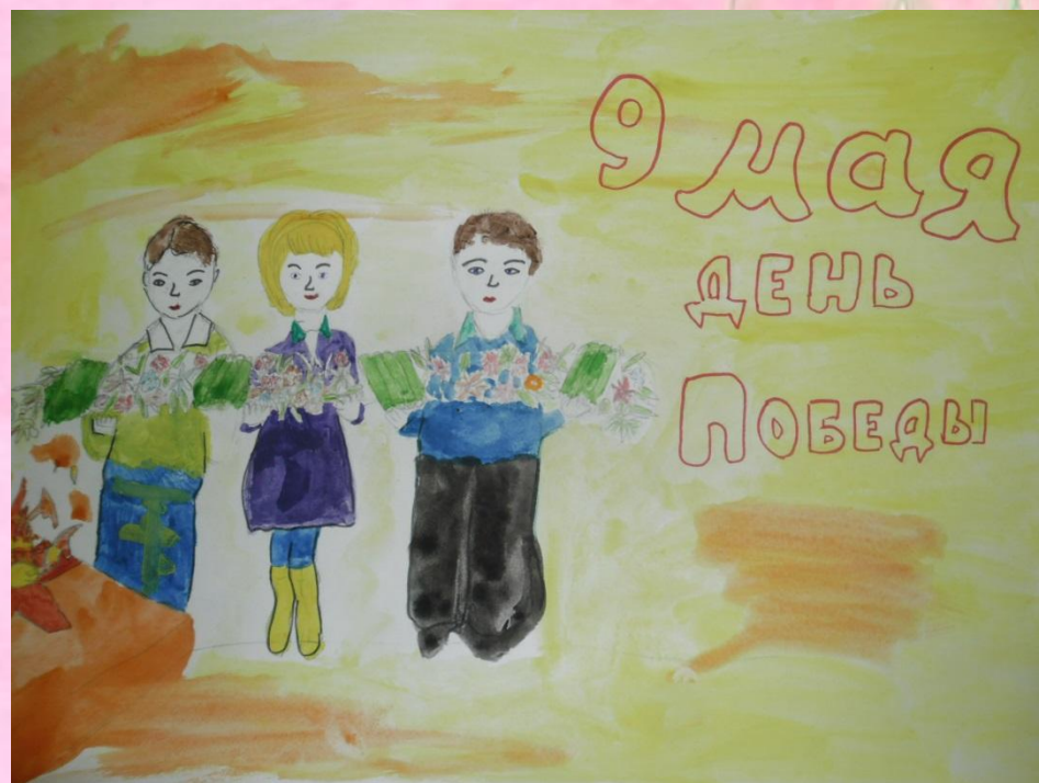
Рисунок воспитанницы 5 группы