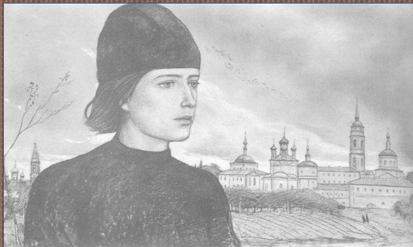
И.Глазунов Алёша Карамазов