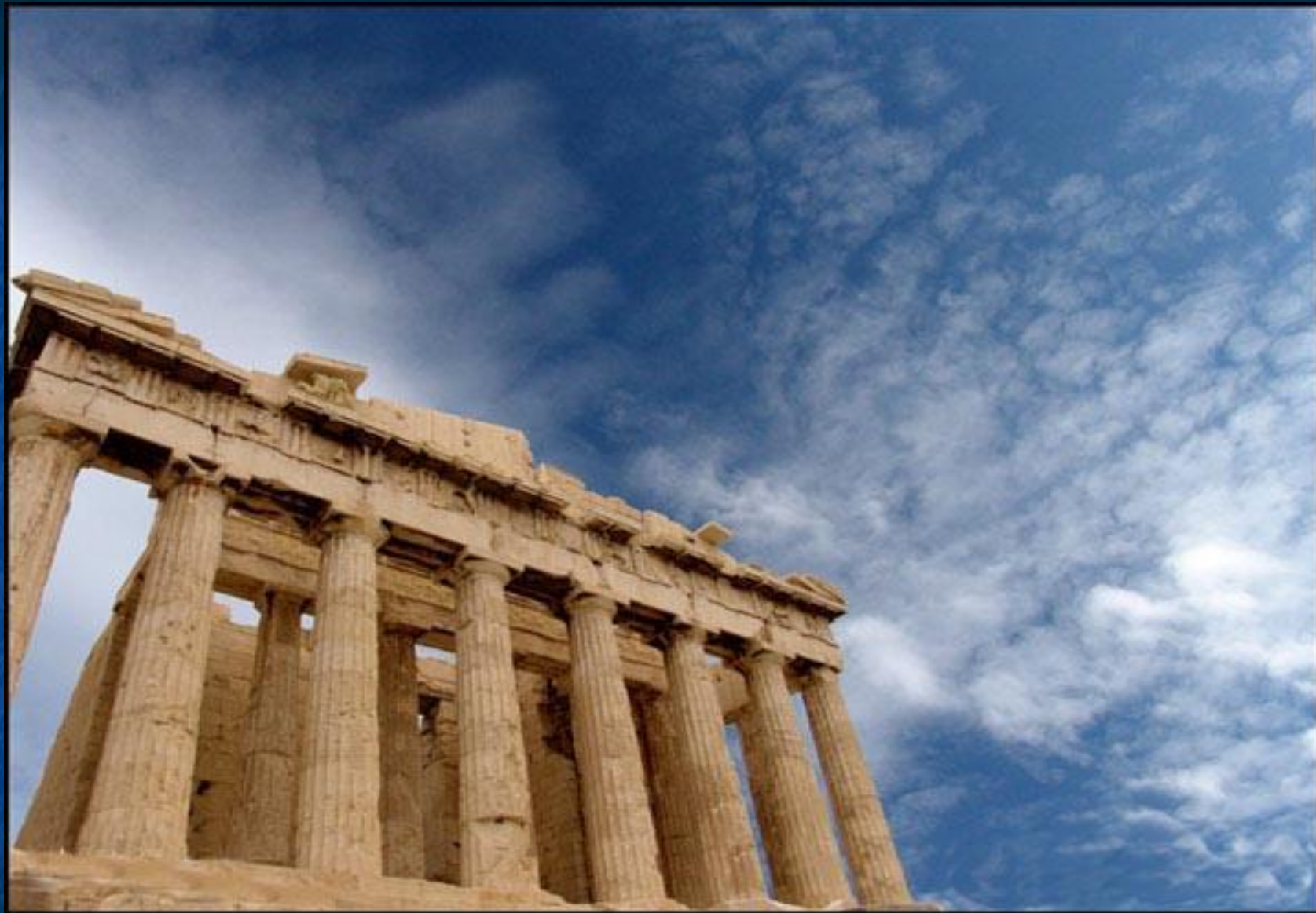
Парфенон. Афины- символ Греции.