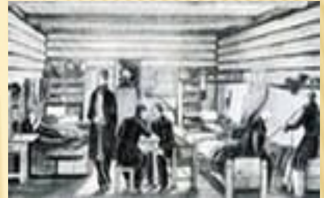
Камера декабристов в Читинском остроге. (рис. декабриста Репина, Героя Отечественной войны), 1829 г.