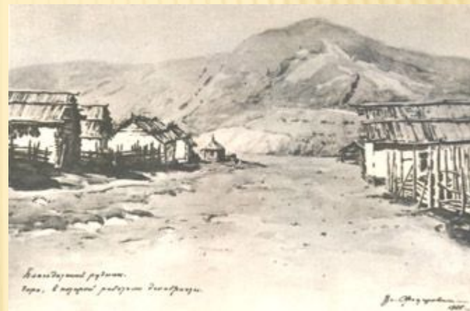
Федорович В.Л. Благодатский рудник.