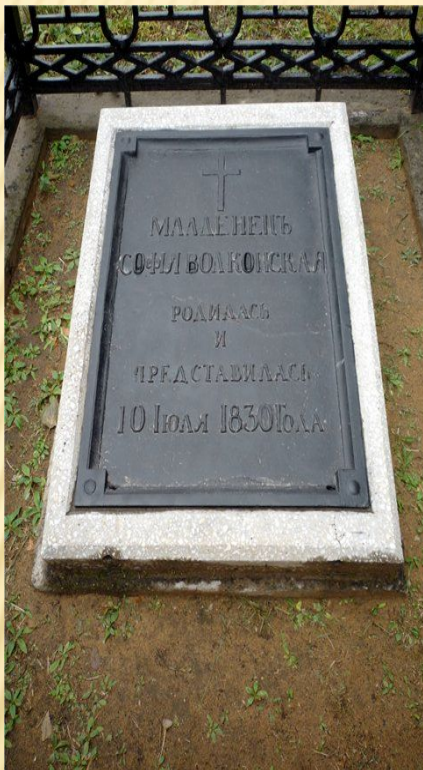
Чита. Церковь Декабристов. Могила дочери Волконских.

Николай (2 января 1826 — 17 января 1828);