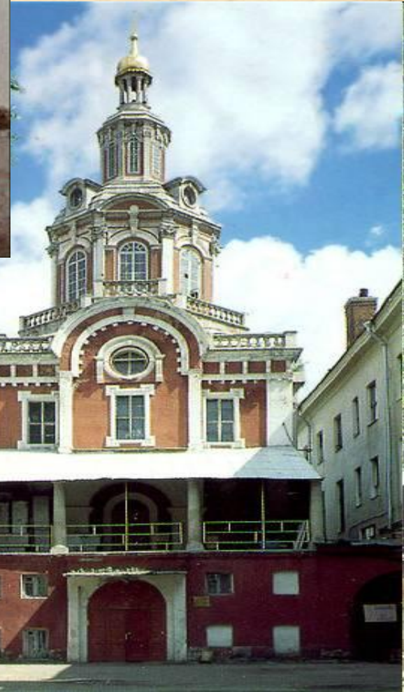
Славяно – греко – латинская академия