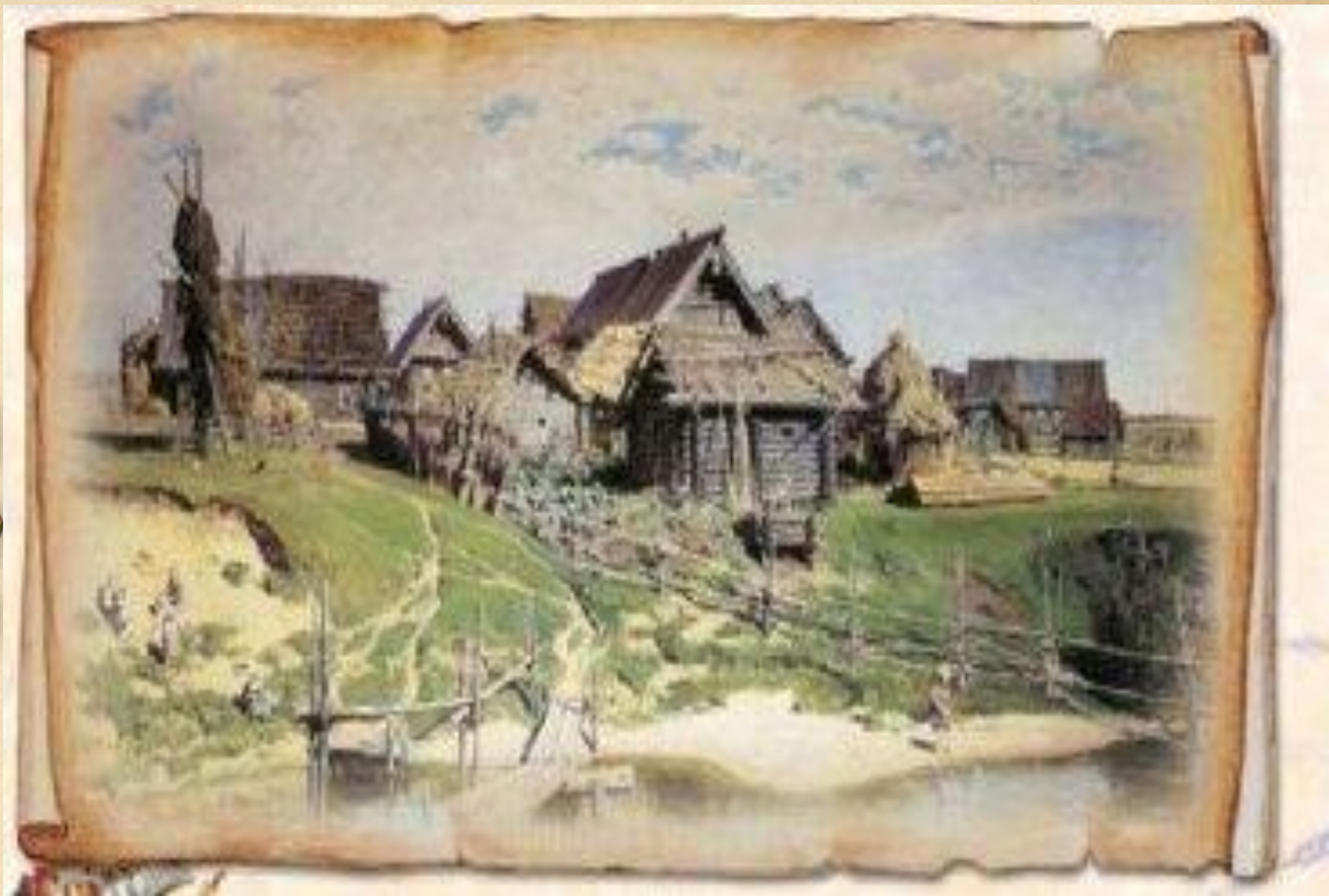
д. Денисовка около села Холмогоры Архангельской губернии