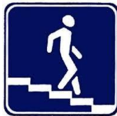
Подземный пешеходный переход