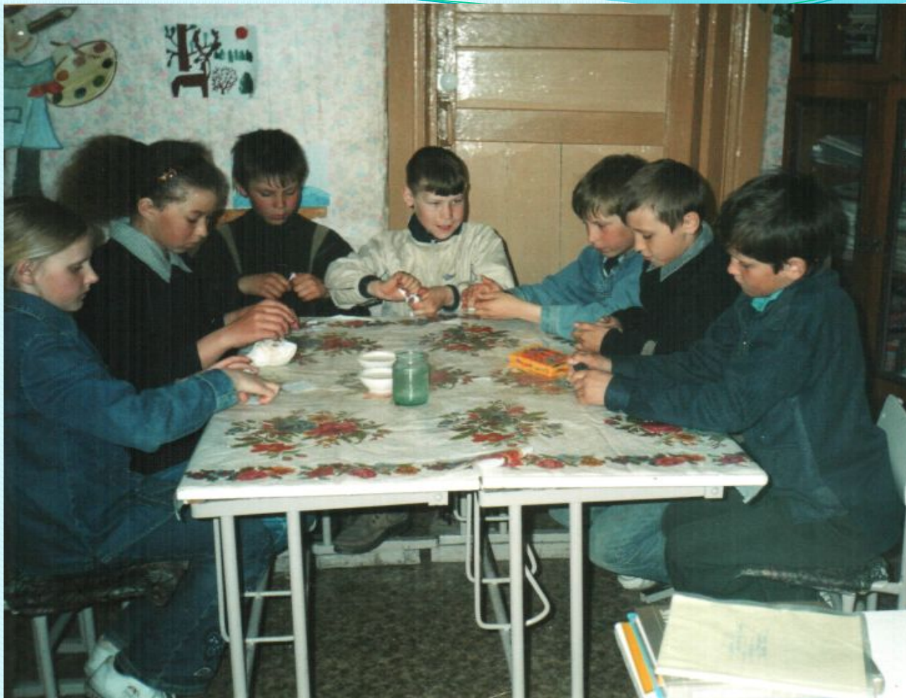
Изготовление кукол по технологии папье-маше