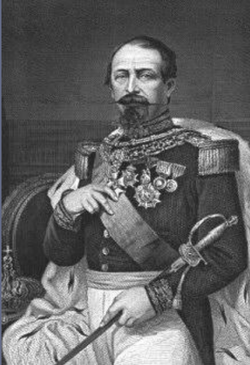
▣ Наполеон III