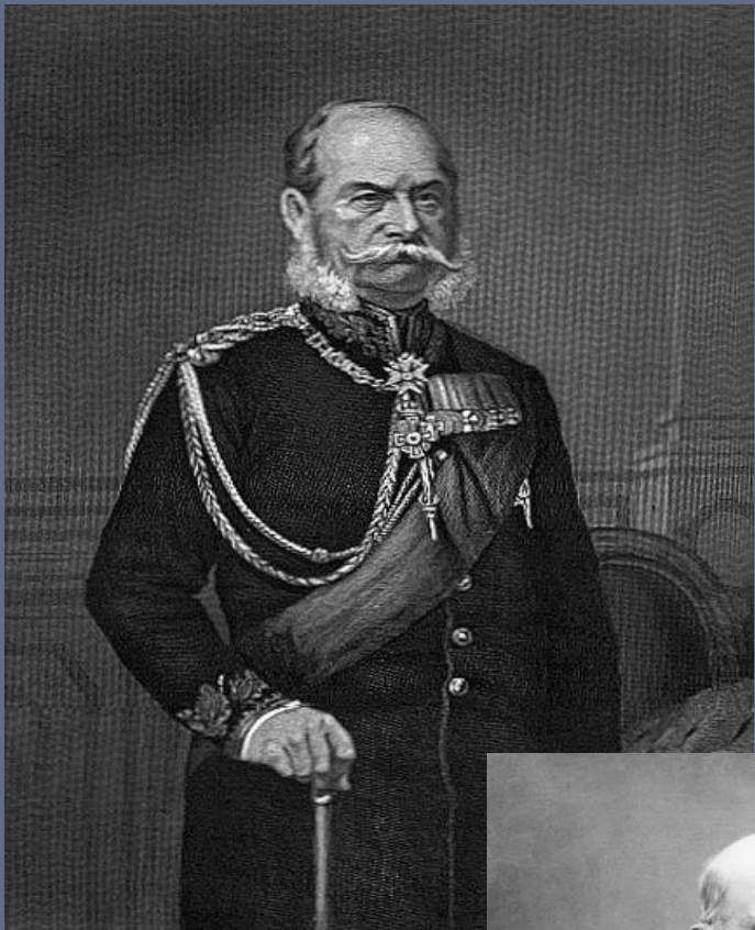
▣ Вильгельм I