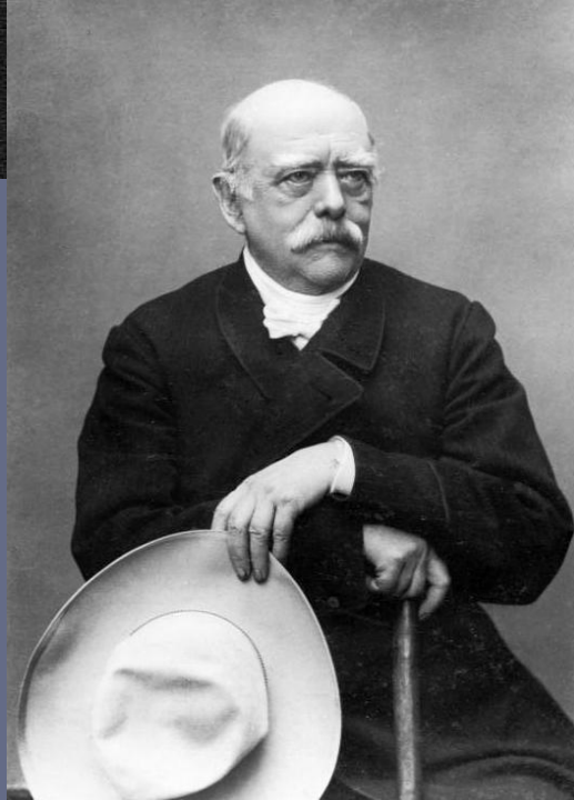
▣ Отто фон Бисмарк