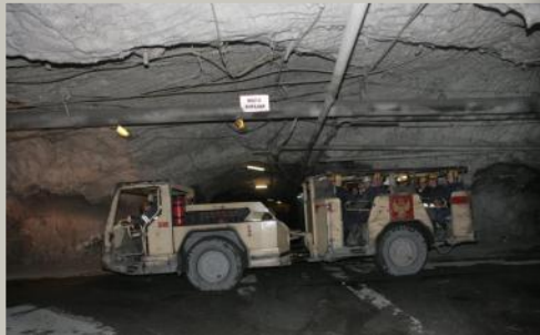
движение в забой на подземном автобусе