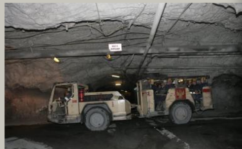
движение в забой на подземном автобусе