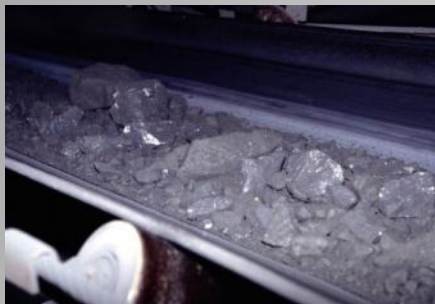
подача руды на мельницы