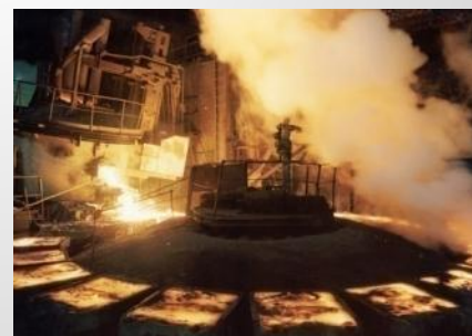
розлив никелевых анодов