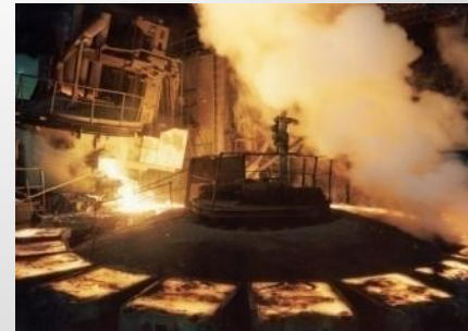
розлив никелевых анодов