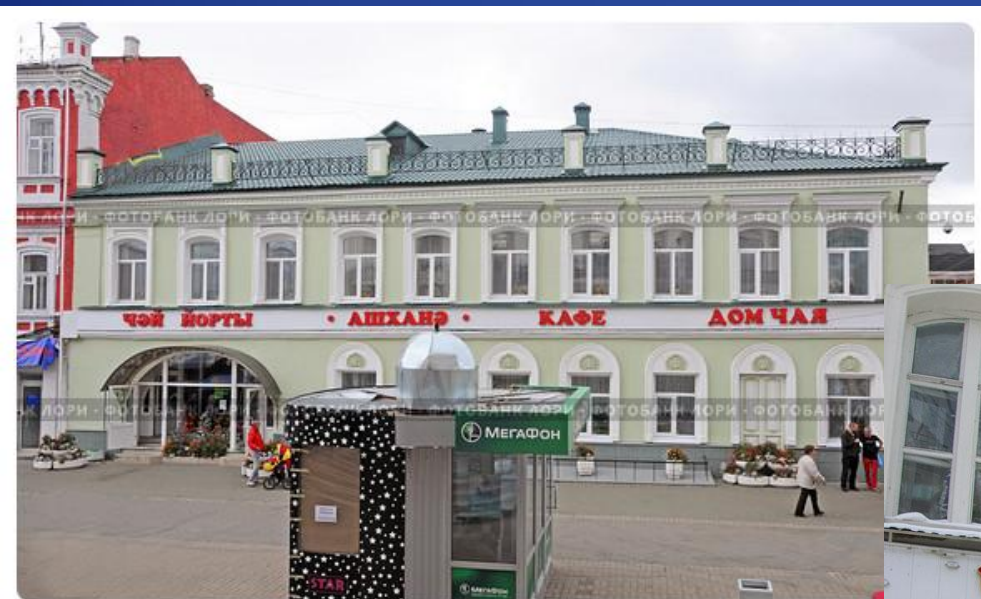
Казань, Дом чая на улице Баумана