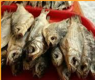
Сушёная рыба (Исландия)