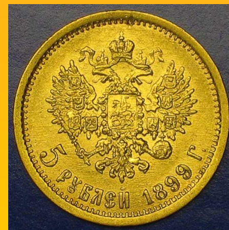
Золотые 5 рублей 1899 г. реверс