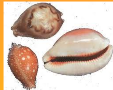
Раковины Каури (Приморье)