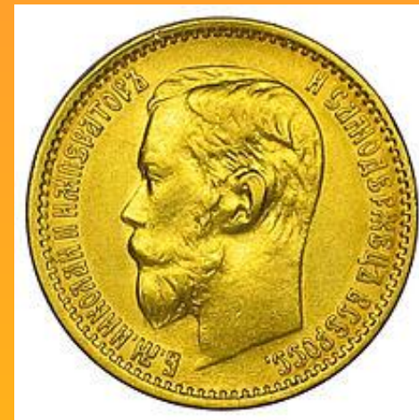
Золотые 5 рублей 1899 г. аверс