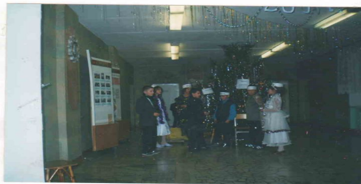
Ләбиб Леронның «Яңа ел биштәре» нән күренеш (5 нче сыйныф укучылары)