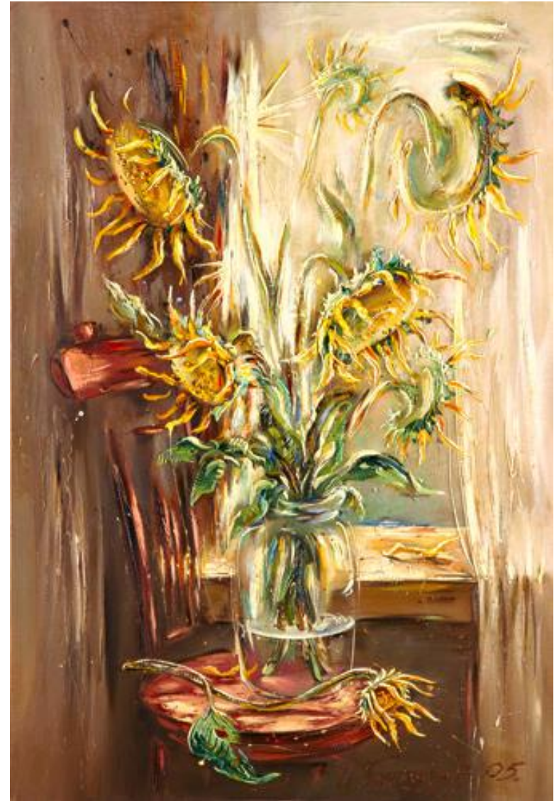
Игорь Гончаров Подсолнечный натюрморт