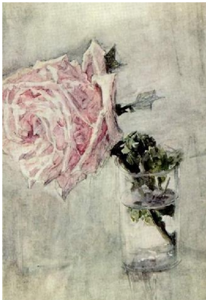
Врубель Михаил Александрович, Роза, 1904.