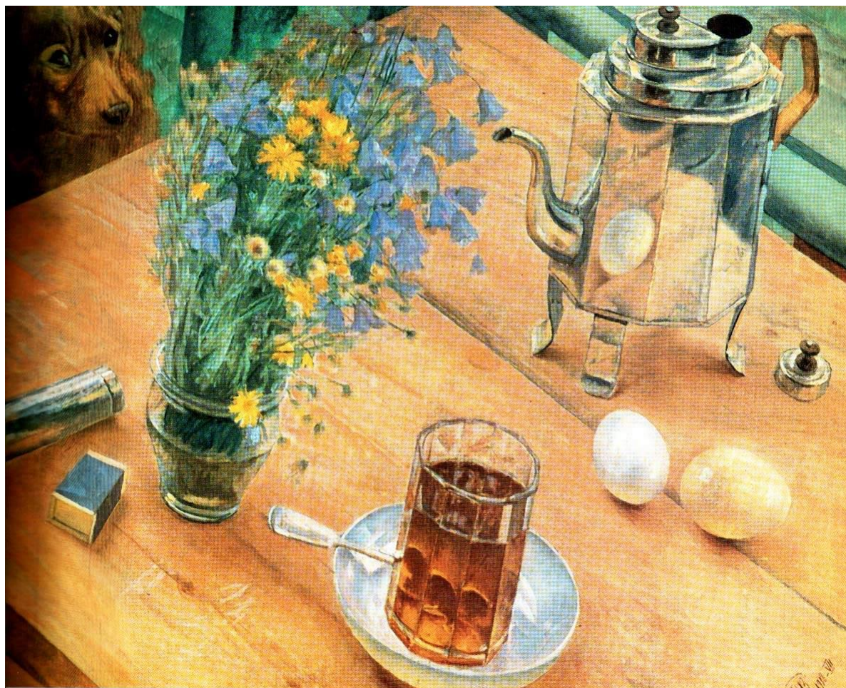
К.С.Петров-Водкин.Утренний натюрморт. 1918.