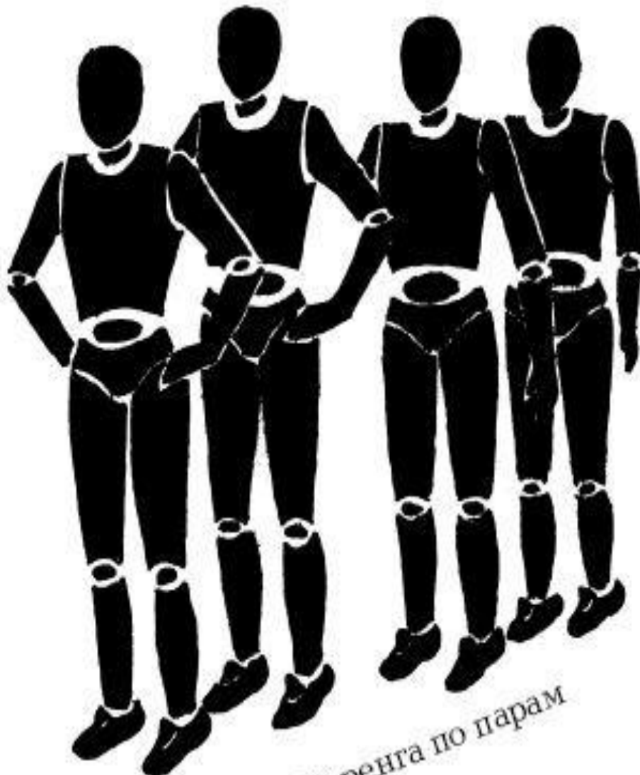
Шеренга по парам