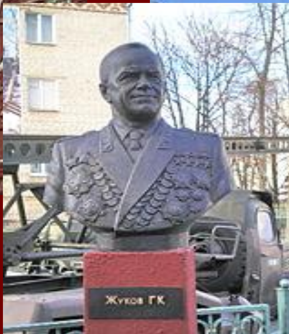
Бюст Жукова в Гомеле