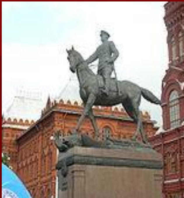
Памятник Жукову в Москве. Скульптор В.М. Клыков