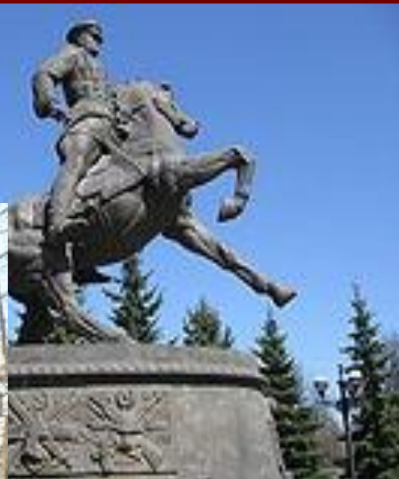
Памятник Жукову в Екатеринбурге