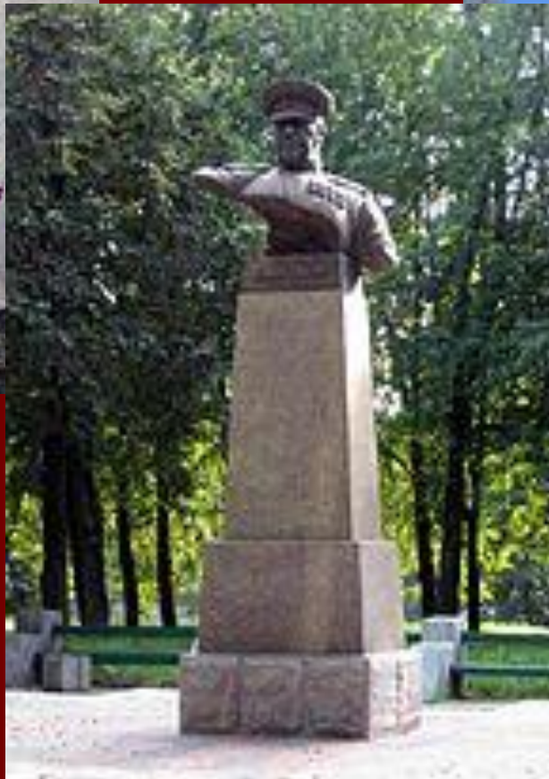
Памятник Жукову в Минске