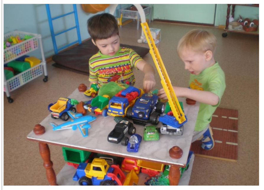
«Мы - водители!»