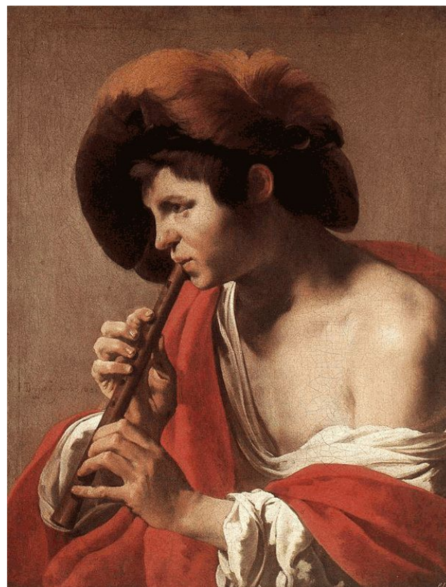
Хендрик Тербрюгген «Мальчик играющий на флейте» 1621г.,

Вот семейство деревянных духовых. Много интересного, знаем мы про них. Им пастушья дудочка – старшая сестра Вот поэтому, ребята, так группа названа