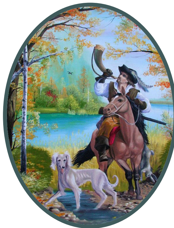
Рамиль Ильясов «Охота» 2002г

Группа медных духовых: Расскажу я и про них! Рог им силу звука дал, Звонкой медью оплетал. Медные, блестящие, По разному звучащие