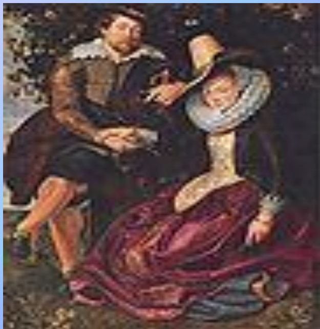
Двойной портрет Рубенс , «Автопортрет с Изабеллой Брант»