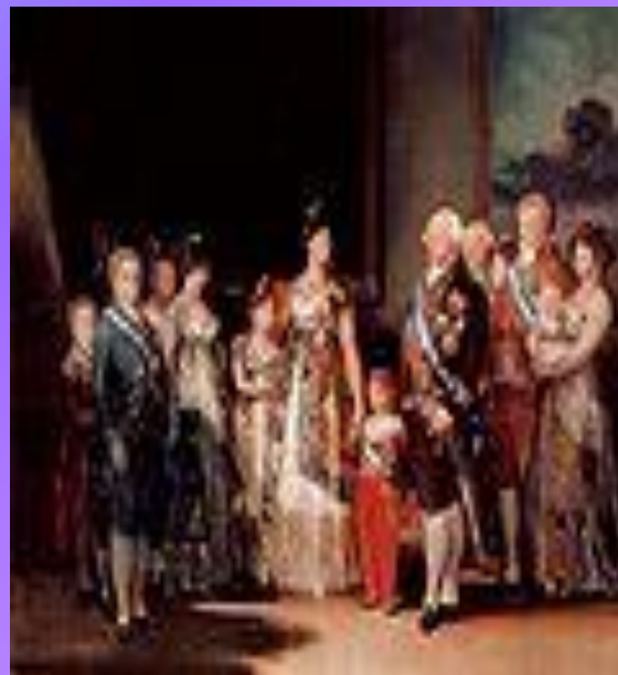
Групповой портрет Гойя , «Портрет семьи Карлоса V»