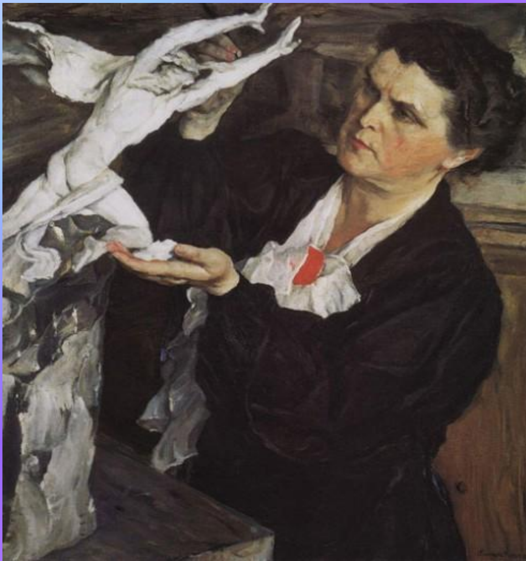
Портрет Веры Игнатьевны Мухиной.