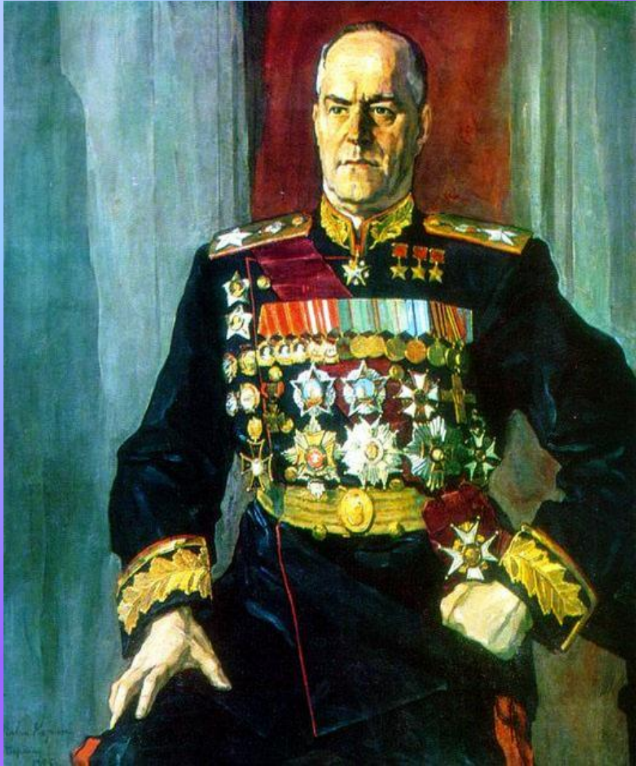
Портрет Маршала Советского Союза Георгия Константиновича Жукова