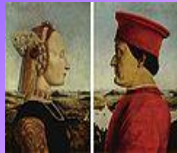
Парный портрет Пьеро делла Франческа , « Герцог и герцогиня урбинские »