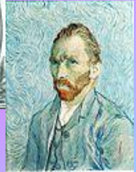
Масло: Ван Гог, « Автопортрет », 1889 год