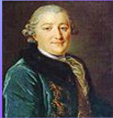
В три четверти Рокотов, «Портрет графа Орлова» , 1762/65