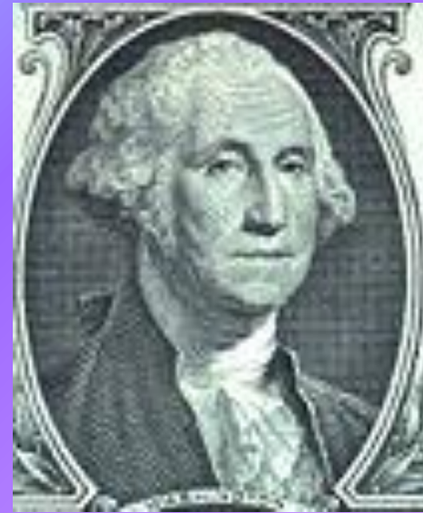
Гравюра: « Портрет Джорджа Вашингтона », фрагмент 1- долларовой купюры, 1863 год