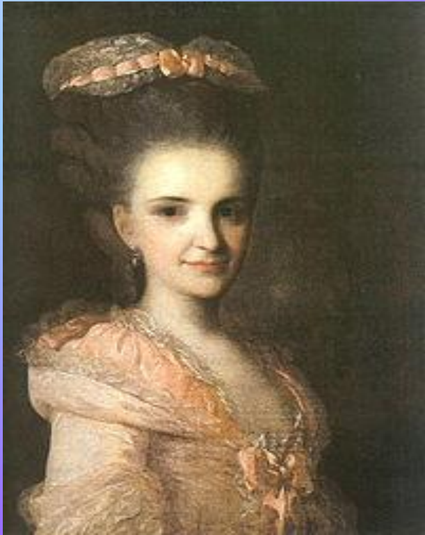
«Портрет неизвестной в розовом платье», 1770-е годы.