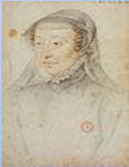
Карандаш: Франсуа Клуэ. « Портрет Екатерины Медичи », ок. 1560 года