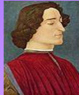
В четверть Ботичелли, «Портрет Джулиано Медичи» , ок. 1478