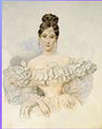
Акварель: Александр Брюллов. « Портрет Натальи Гончаровой », 1831 год