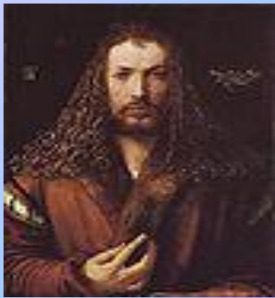
В анфас Дюрер, «Автопортрет» , 1500