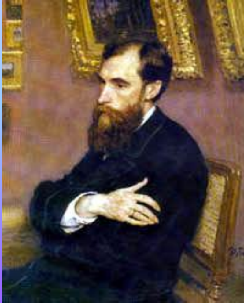
РАБОТА И.Е. РЕПИНА

Спокойный, немного грустный, Третьяков стоит, скрестив на груди руки – это была его любимая поза, - стоит, размышляя о судьбах русской живописи.