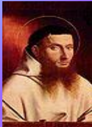
В пол- оборота Петрус Кристу́с, «Картезианец» , 1446