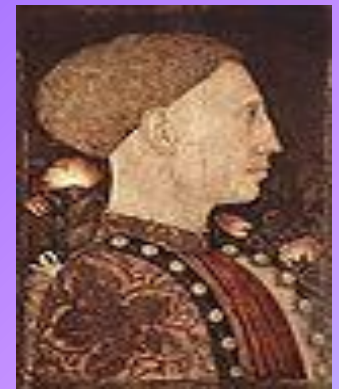
Профиль Пизанелло, «Портрет Лионелло д'Эсте» , 1441