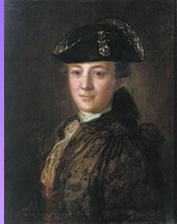
«Портрет неизвестного в треуголке»

Все портреты кисти Ф. Рокотова узнаются по улыбке и «сладкому» выражению лица