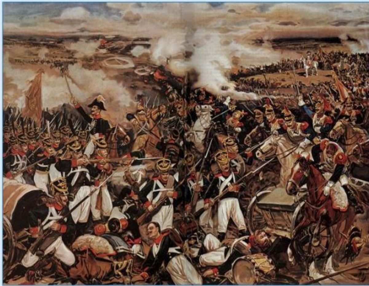
Иллюстрация к стихотворению М.Ю. Лермонтова «Бородино» Н. Платова