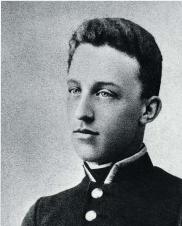
Александр Блок, 18 лет, 1898