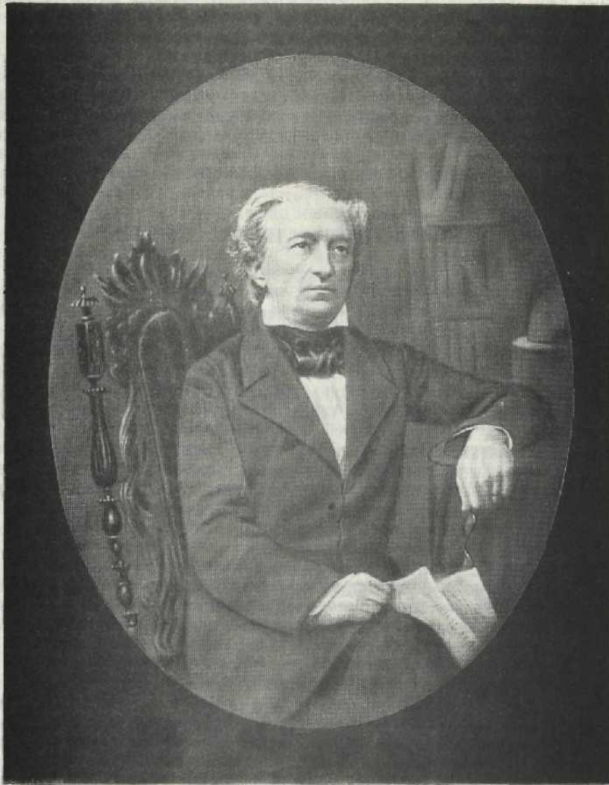
Ф. И. Тютчев. Фотография. 1850-е гг.