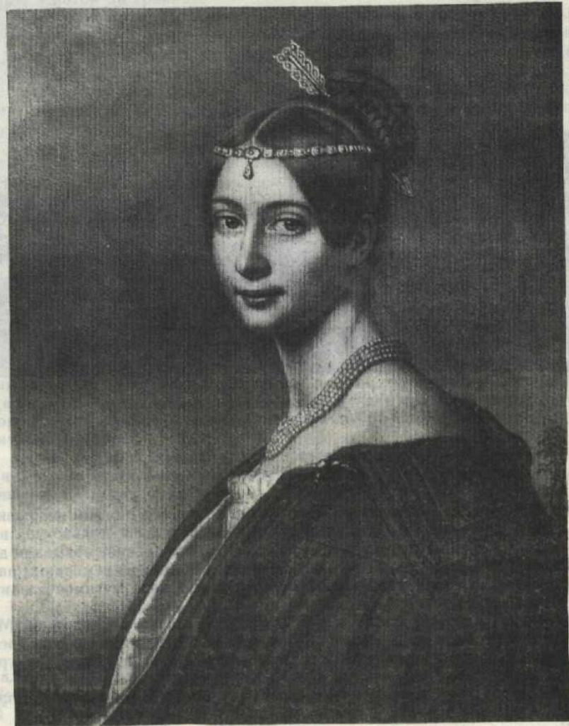
Эрн. Ф. Тютчева, вторая жена поэта. Литография Г. Бодмера с портрета работы И. Шилера.

Элеонора Тютчева (Петерсон), первая жена поэта