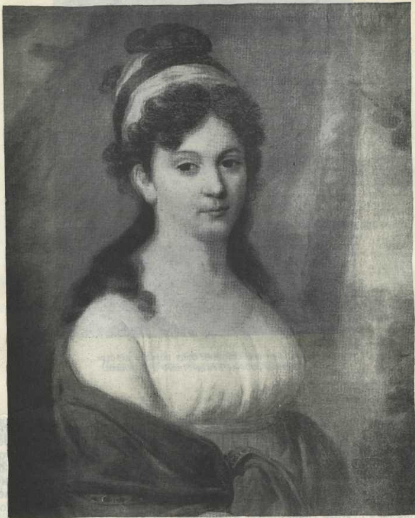
Е. Л. Тютчева, мать поэта. Портрет работы неизвестного художника.