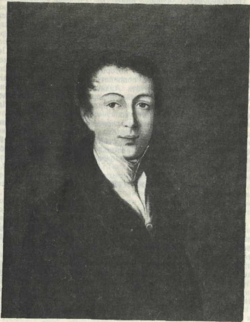
Ф. И. Тютчев.