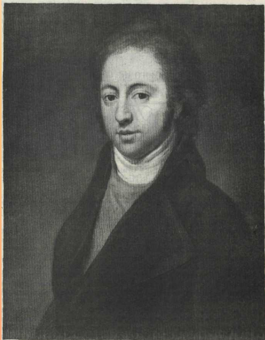
И. Н. Тютчев, отец поэта. Портрет работы художника Ф. Кючеля.