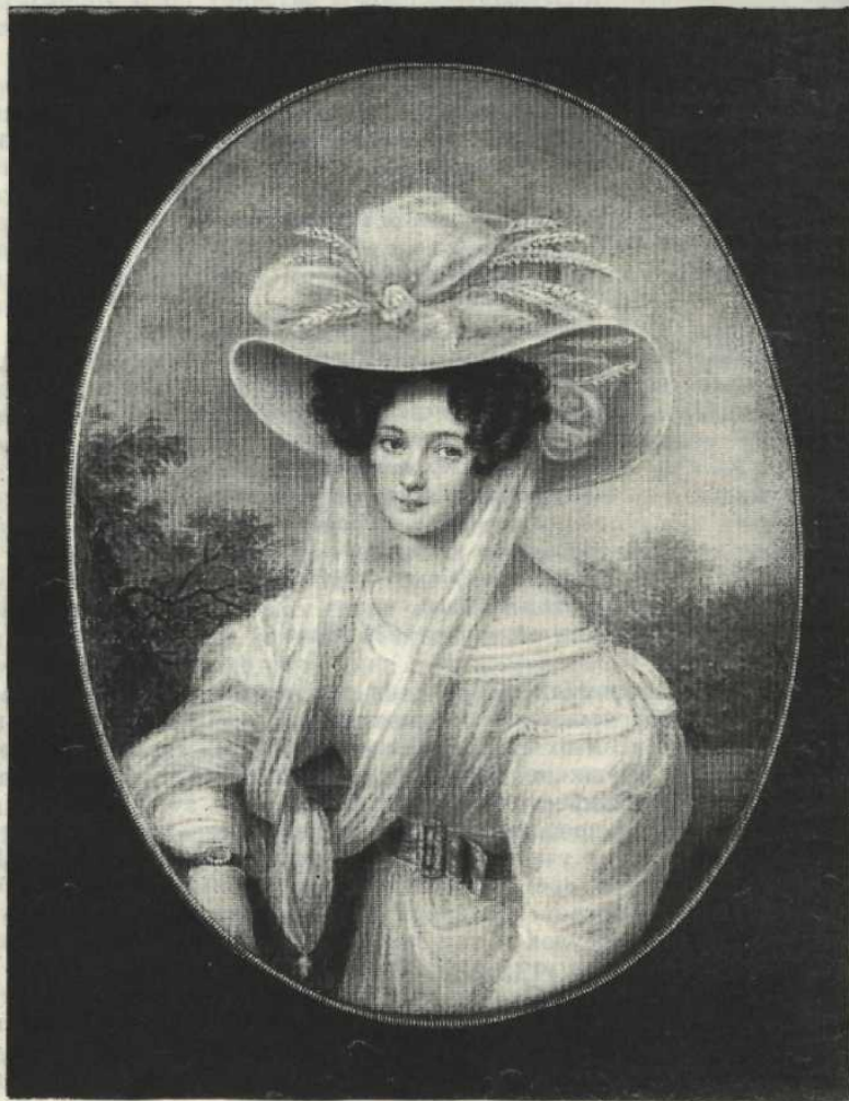
Эл. Ф. Тютчева, первая жена поэта. Миниатюра И. Шелера.

Элеонора Тютчева (Петерсон), первая жена поэта