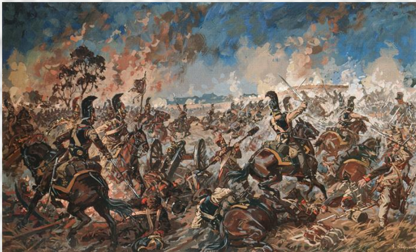
БОЙ ЗА ШЕВАРДИНСКИЙ РЕДУТ. 2002 АВЕРЬЯНОВ А.Ю.