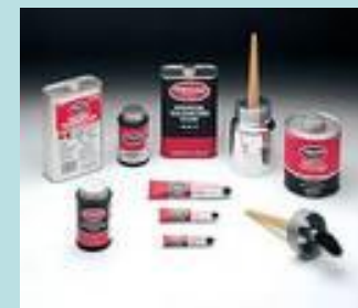
лаки, клей, краски