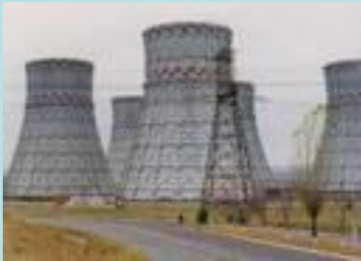
ТЭС Тепловая электростанция