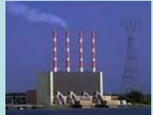
АЭС Атомная электростанция