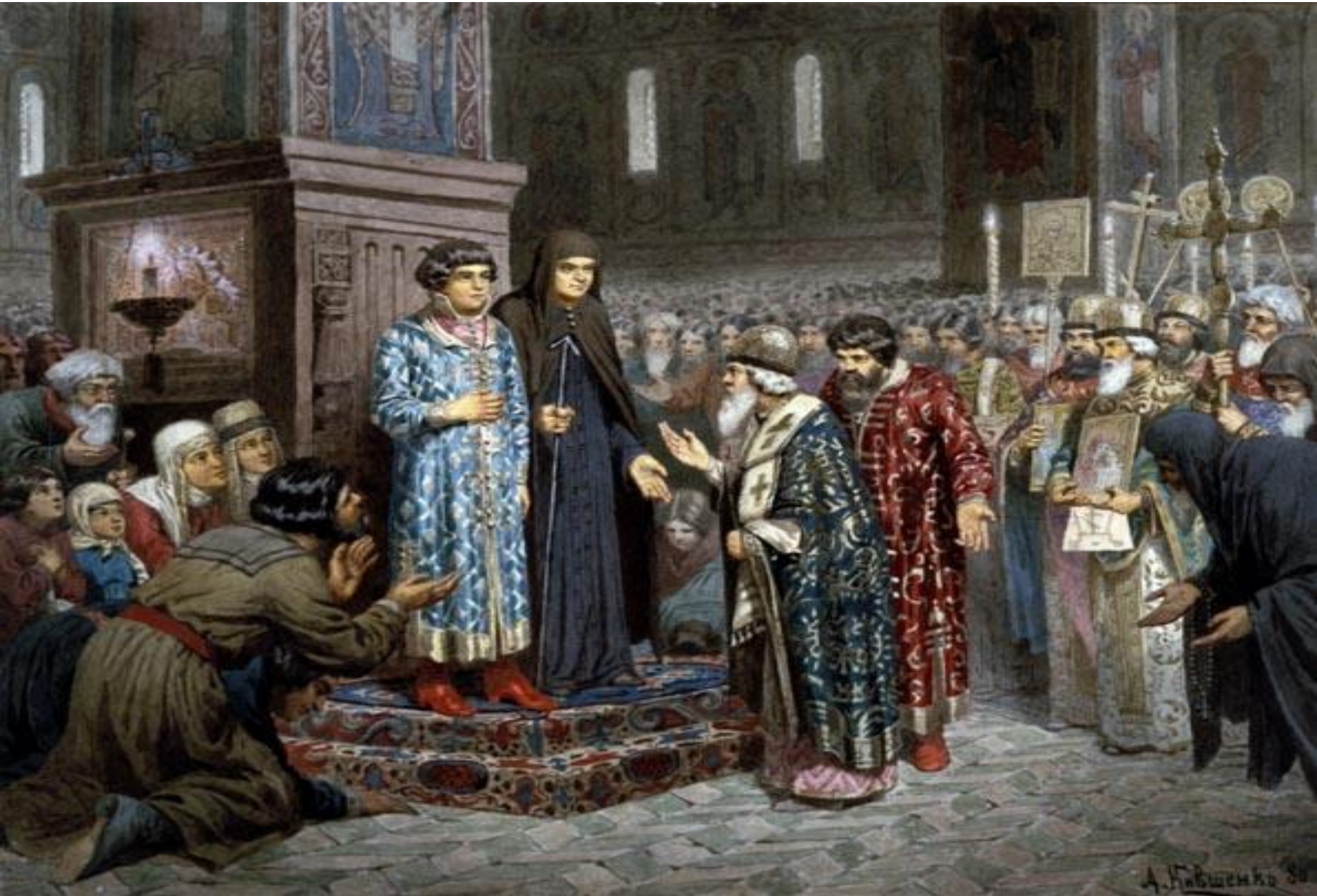
Призвание Романовых на царство. Худ. А. Кившенко