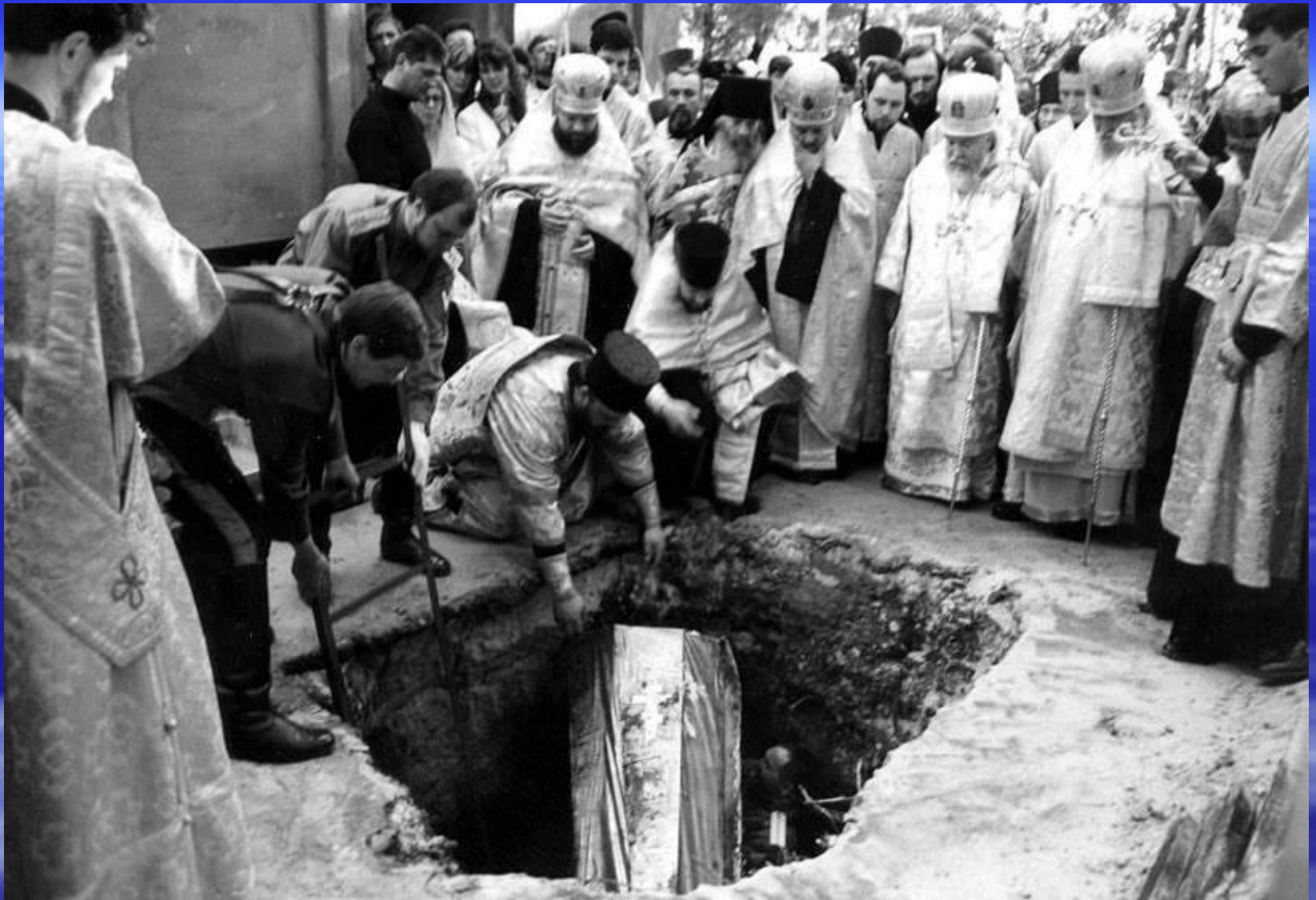
Обретение мощей святого блаженного Андрея 3 июня 1998 года.