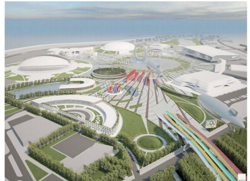
ВИД С ПТИЧЬЕГО ПОЛЕТА НА АВАНПЛОЩАДЬ И ГЛАВНУЮ ОЛИМПИЙСКУЮ ПЛОЩАДЬ