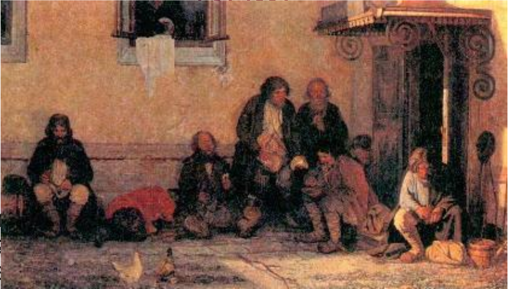
Г.Мясоедов «Земство обедает»