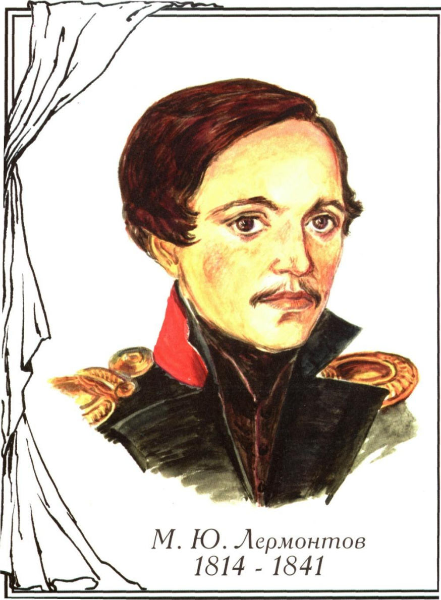
М. Ю. Лермонтов 1814 - 1841