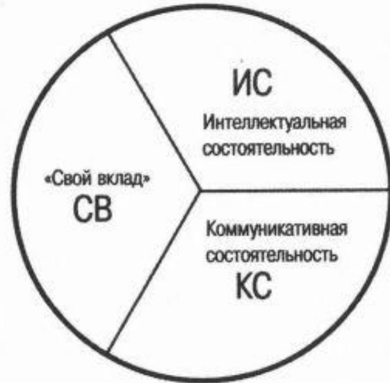
Структура ученического счастья