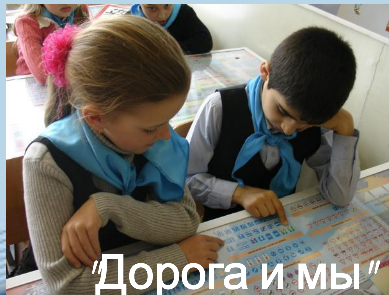
“Дорога и мы”