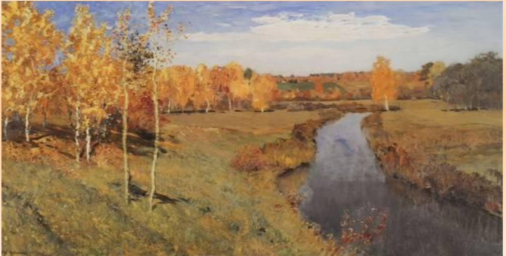
■ «Золотая осень»

(1860-1900), русский живописец крупнейший мастер русского пейзажа конца 19 века