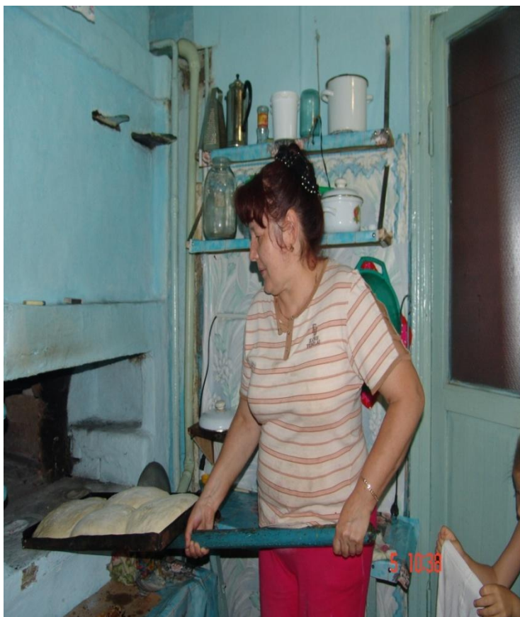
Помогаю бабушке готовить