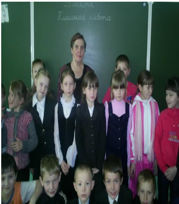
Беседа и помощь ветеранам