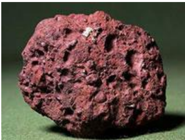
Боксит (алюминиевая руда»