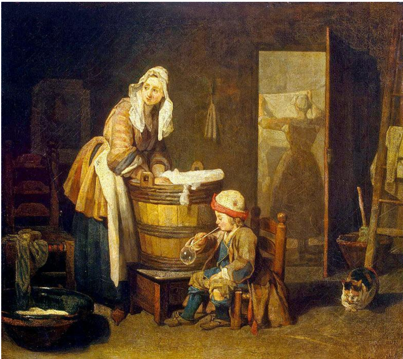
Ж.Б.С.Шарден. «Прачка». 1737 г. (ГЭ). Реализм