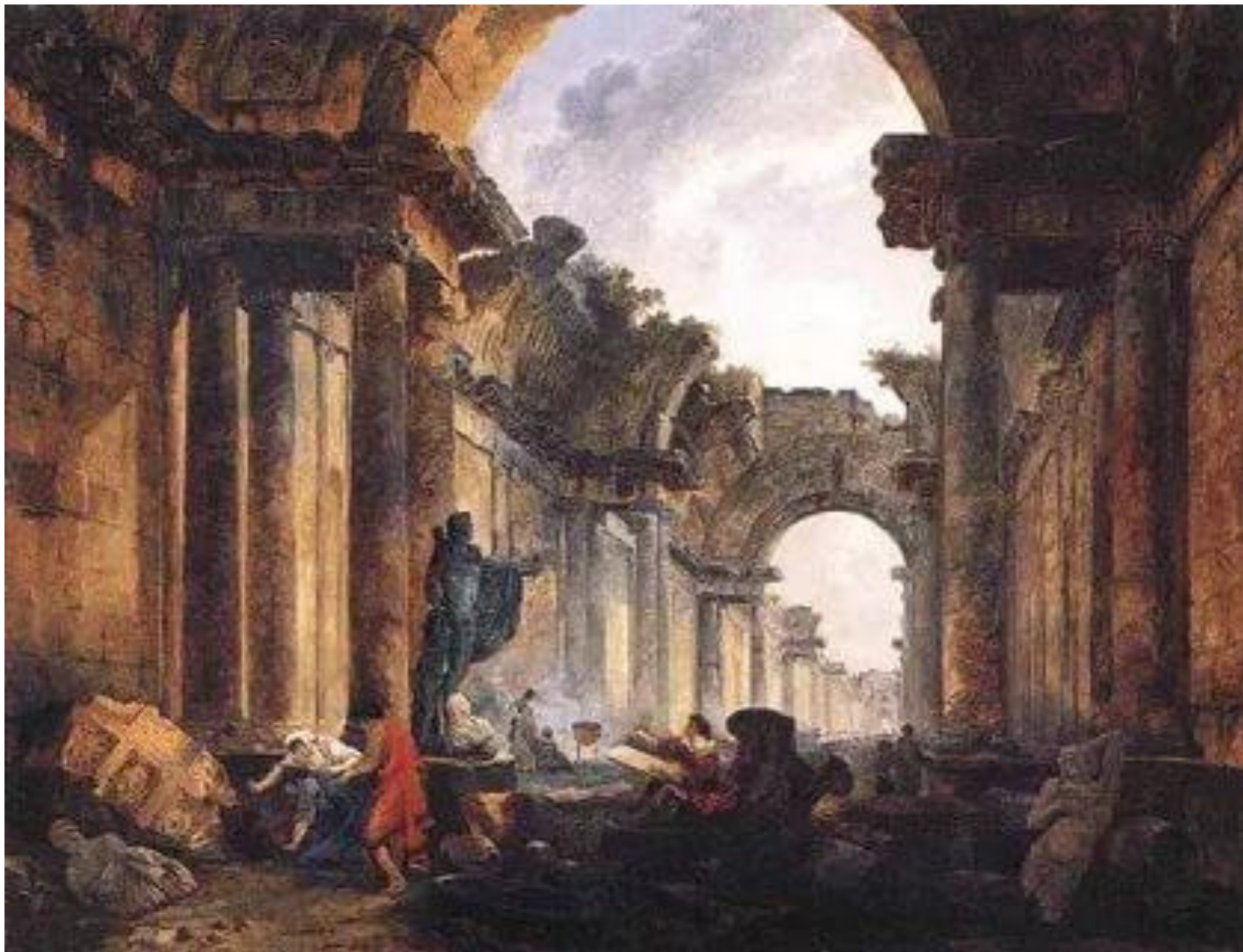
Юбер Робер (1733–1808). «Руины». Предромантизм