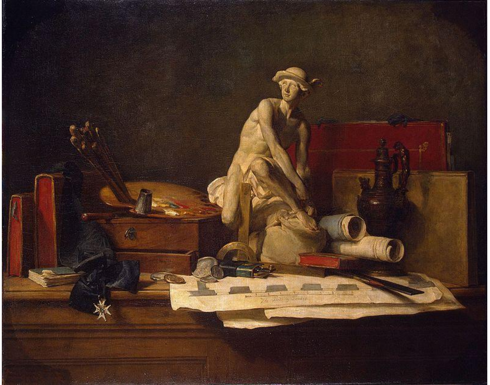
Ж.Б.С.Шарден. «Натюрморт с атрибутами искусства». 1766 г. (ГЭ). Реализм.