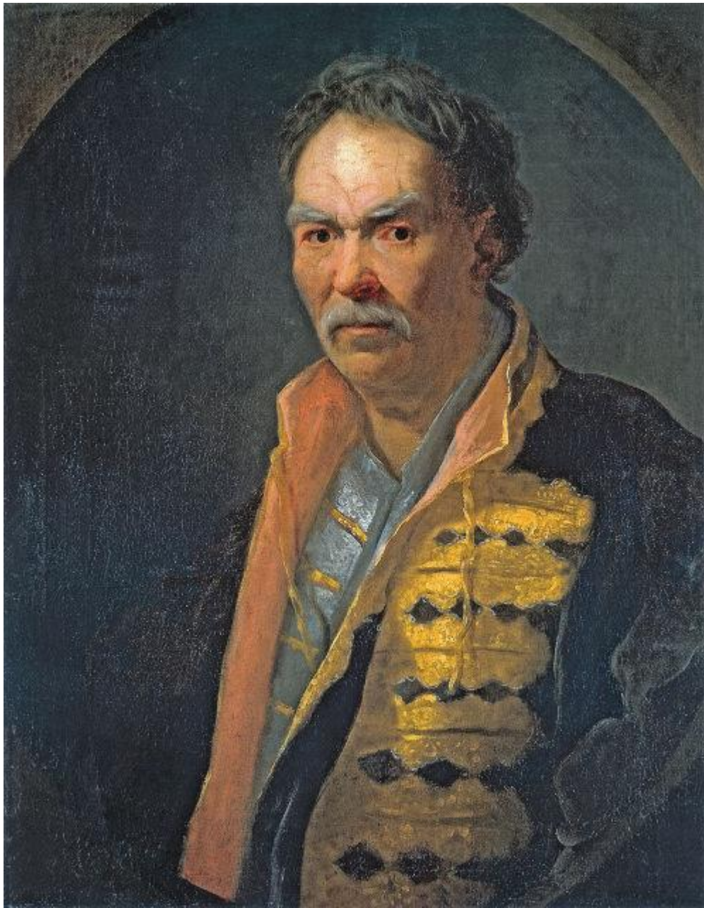
Иван Никитич Никитин (ок. 1690–1742). «Портрет напольного гетмана». Начало 1720-х гг. Реализм