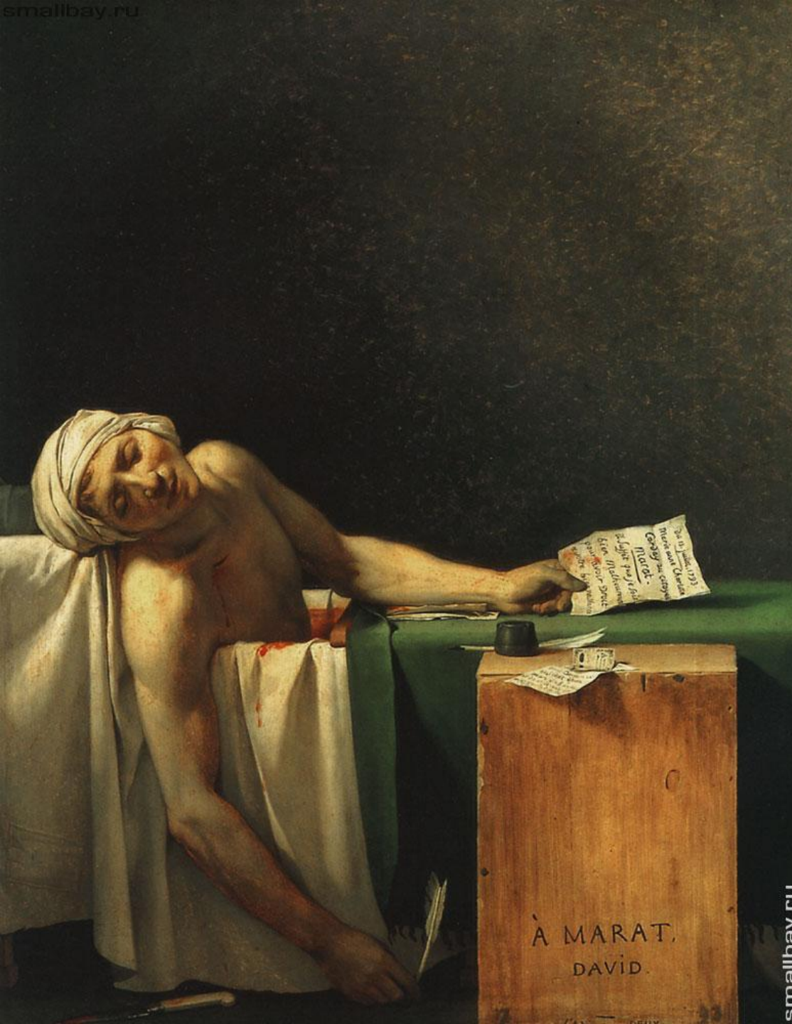
Жак Луи Давид «Смерть Марата». 1793 г. Классицизм («революционный классицизм»).