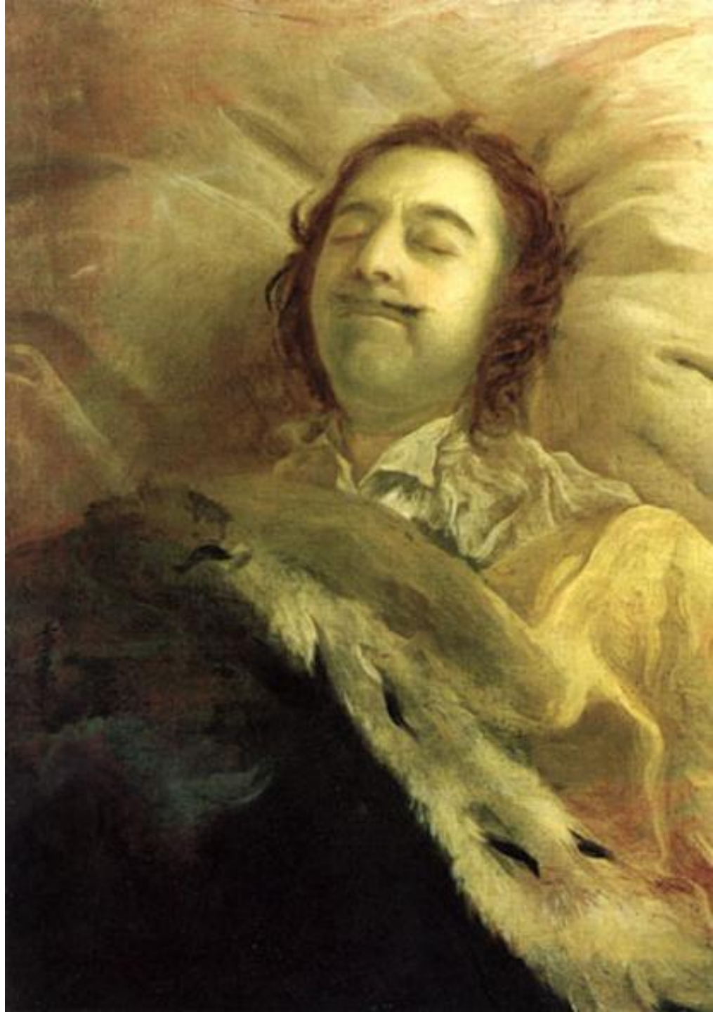
И.Н.Никитин. «Петр I на смертном ложе». 1725 г. Реализм