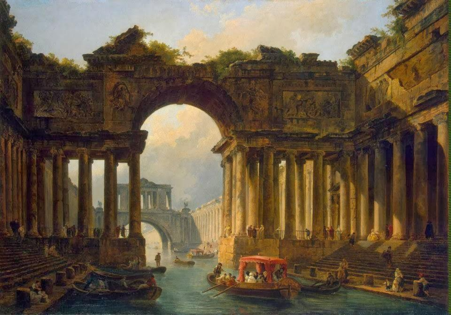
Юбер Робер (1733–1808). «Руины». Предромантизм.