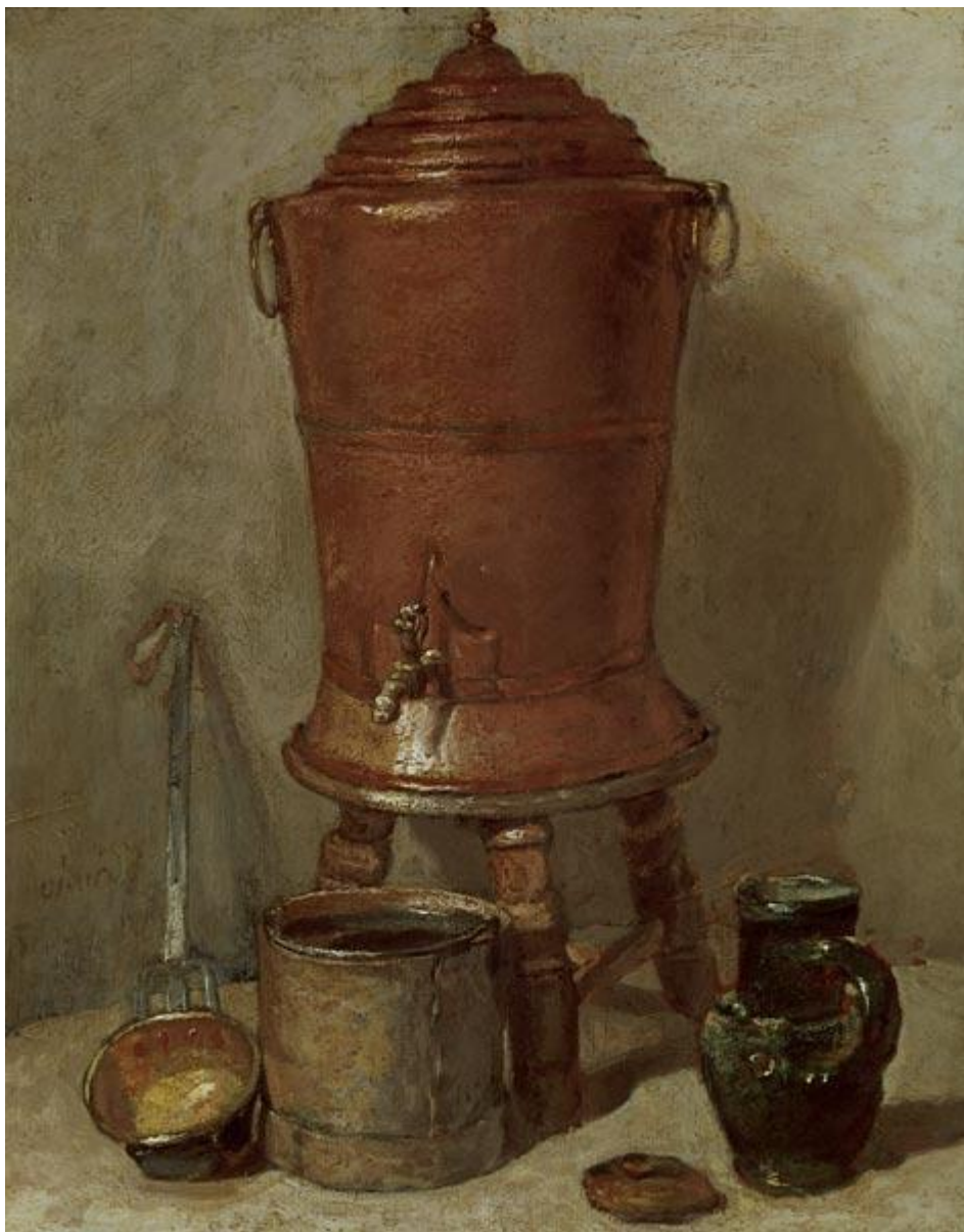
Жан Батист Симеон Шарден (1699–1779). «Медный бак». 1734. Реализм.