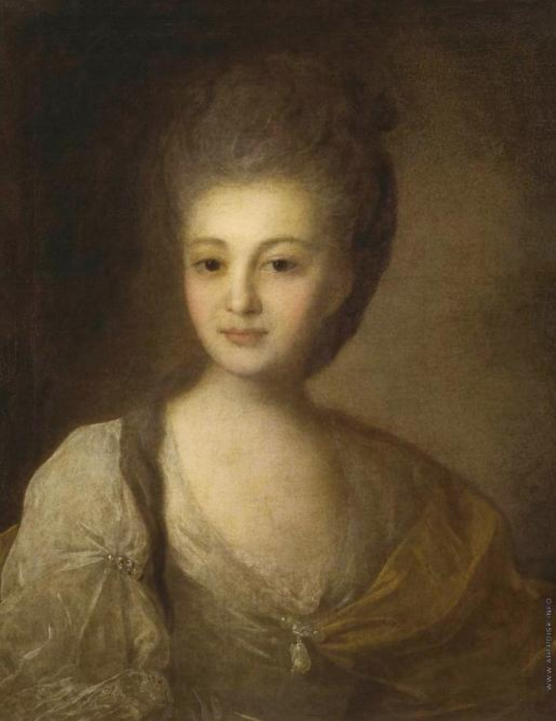
Федор Степанович Рокотов (1735–1808). «Портрет А.Л.Струйской». 1772 г. Основная тенденция — сентиментализм.