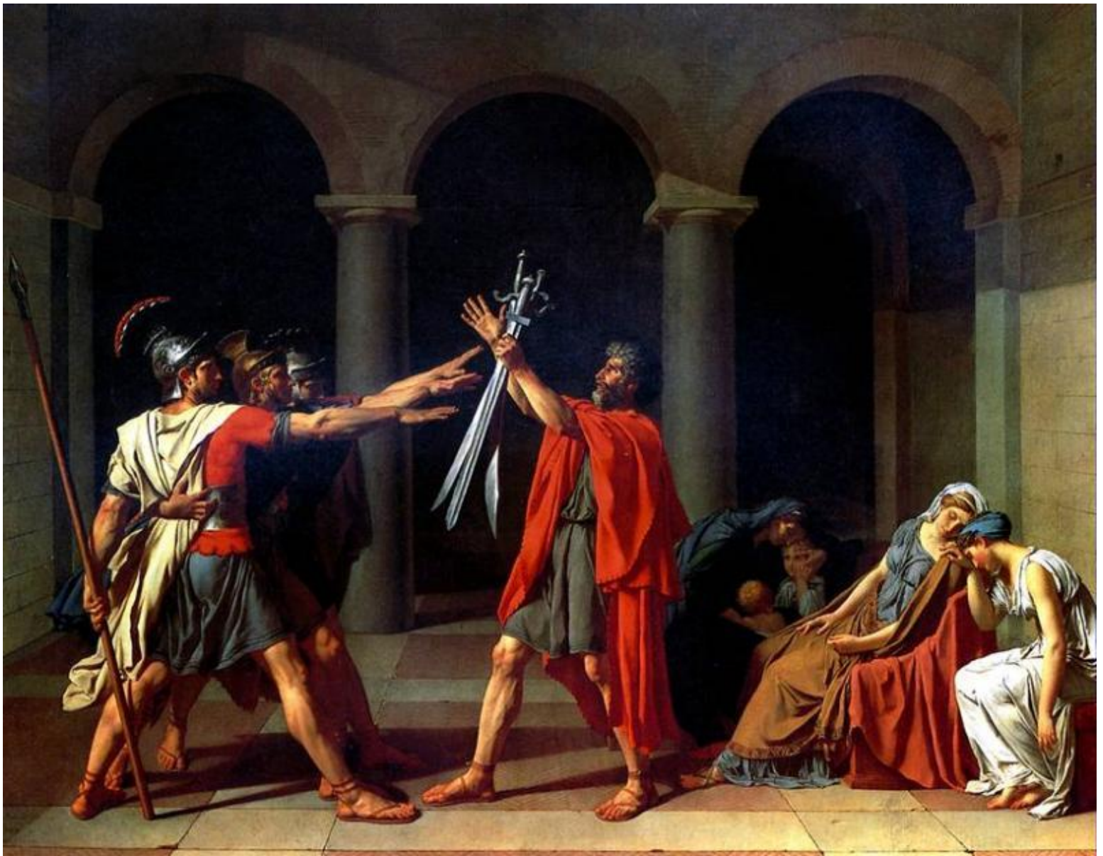
Жак Луи Давид (1748–1825). «Клятва Горацев». 1784 г. Классицизм («революционный классицизм»). Ж.Л. Давид