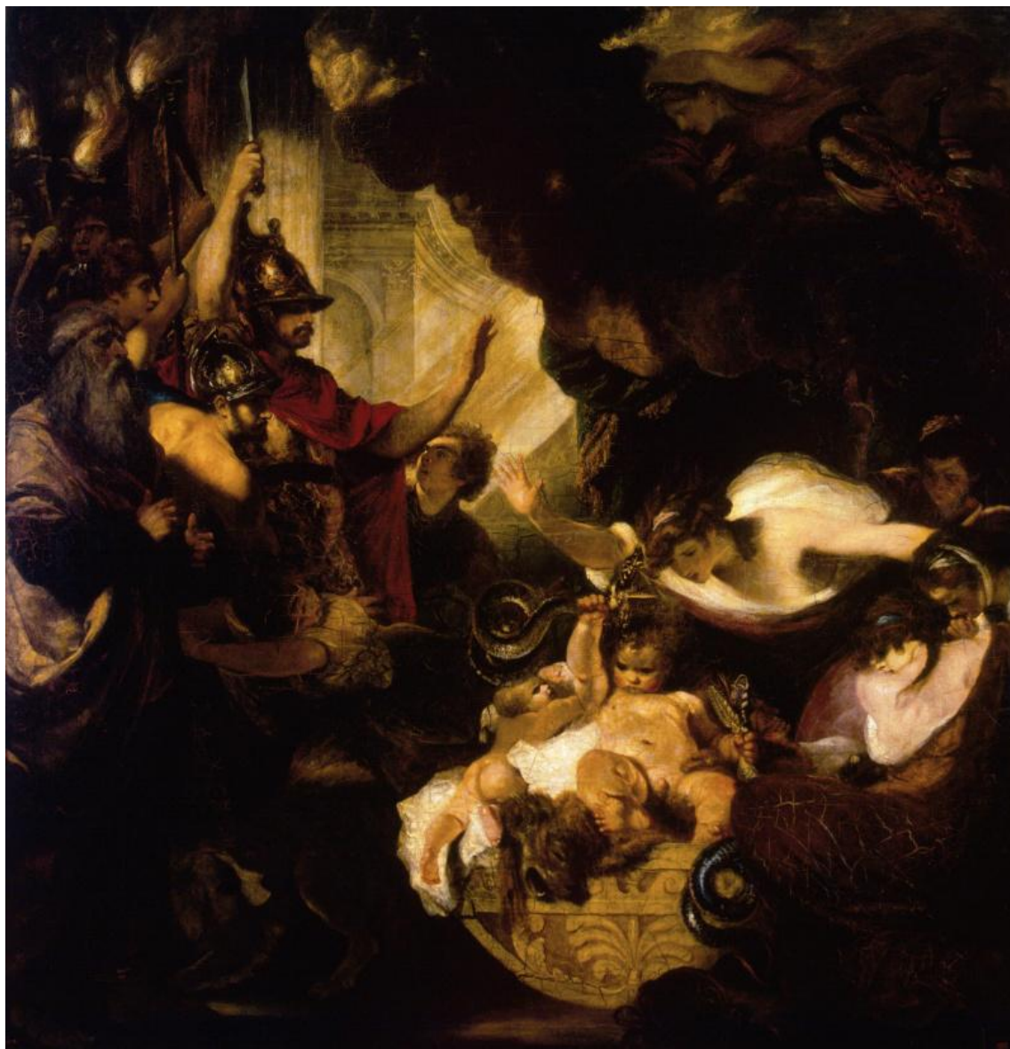
Джошуа Рейнолдс (1723–1792). «Младенец Геракл, удушающий змей». (ГЭ). Позднее барокко.