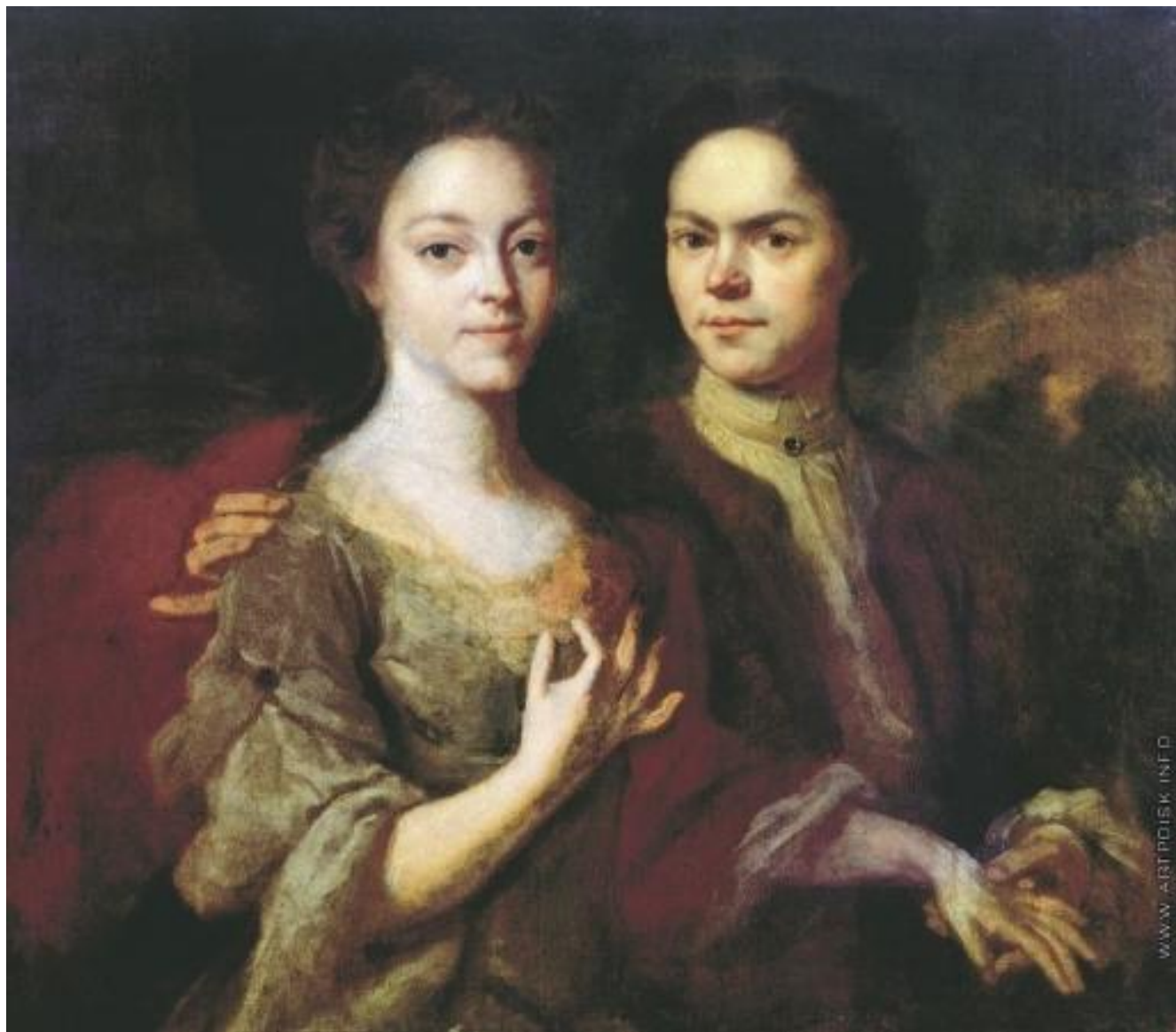
Андрей Матвеевич Матвеев (1701–1739). «Автопортрет с женой». 1729 г. Реализм