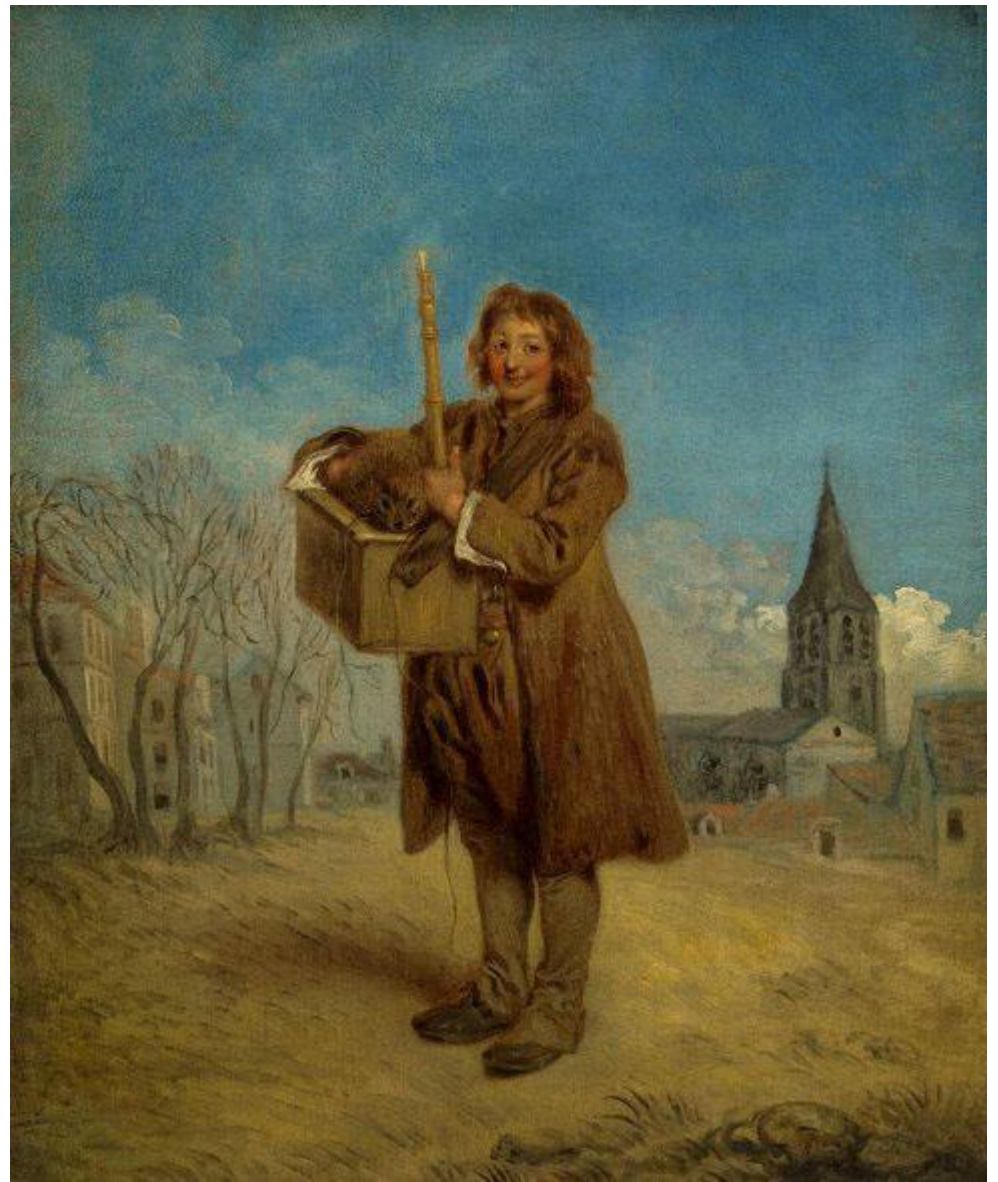
Антуан Ватто (1684–1721). «Савояр с сурком». (ГЭ). Предтеча рококо.