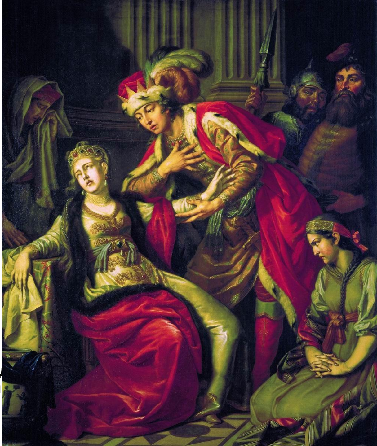
А.П.Лосенко. «Владимир перед Рогнедой». 1770 г. Классицизм