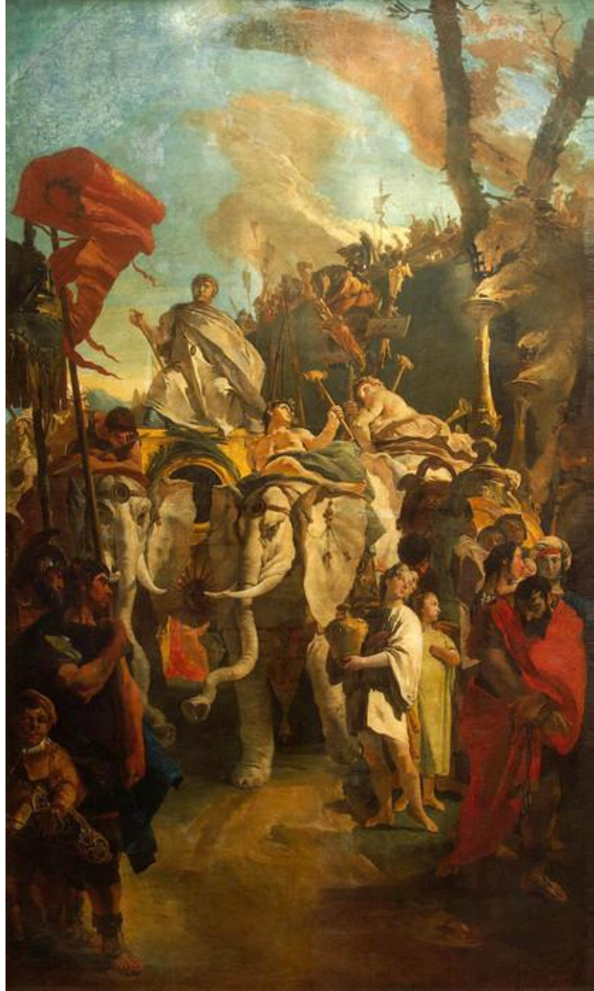
Д.Б.Тьеполо. «Триумф полководца» (ГЭ). Позднее барокко.