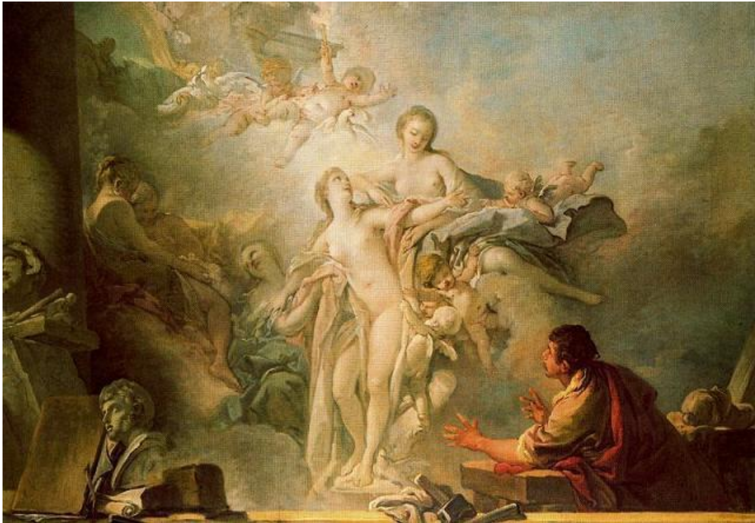
Ф.Буше. «Пигмалион и Галатеея». 1767 г. (ГЭ). Рококо