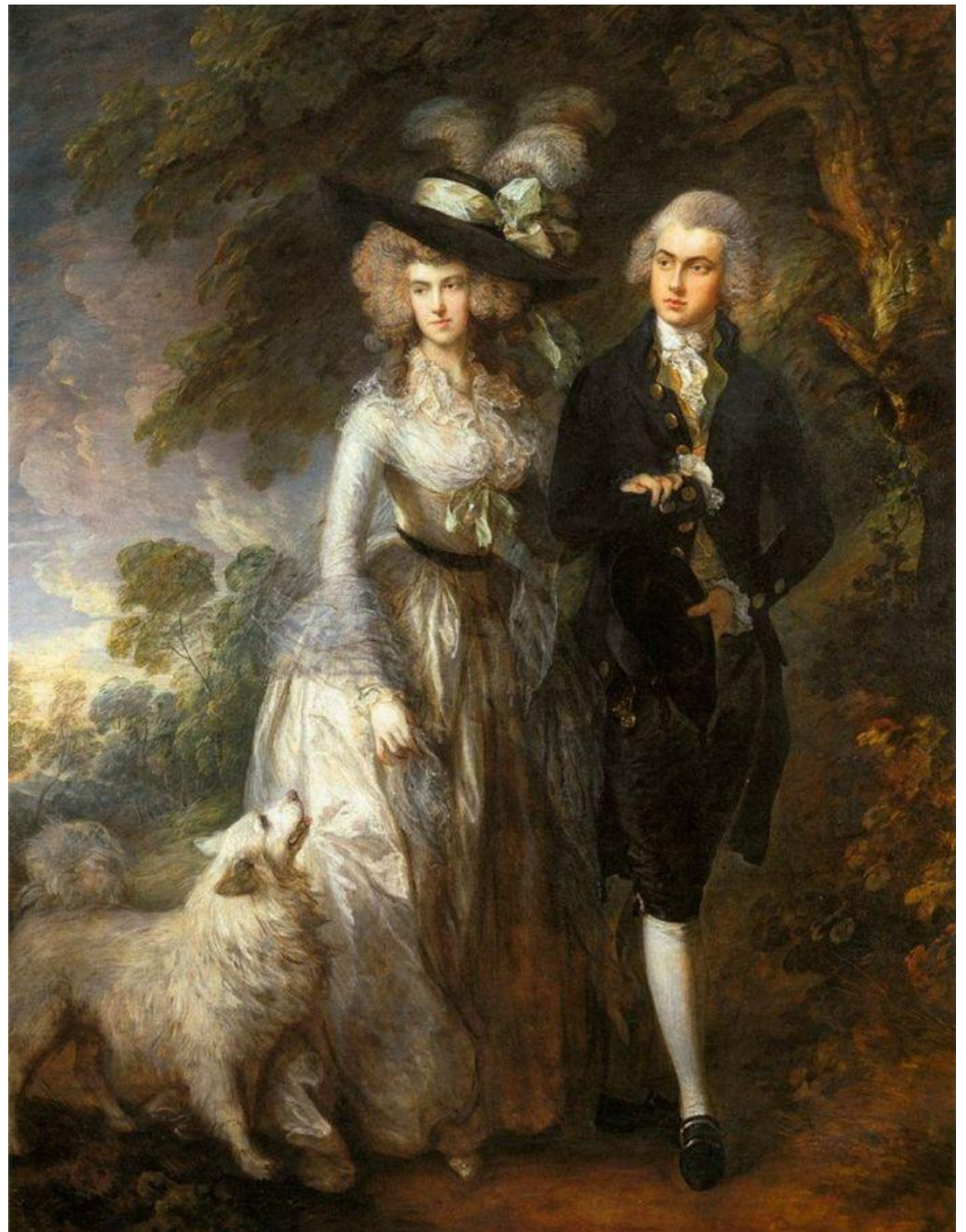
Томас Гейнсборо (1727–1788). «Утренняя прогулка». 1785 г. Сентиментализм.