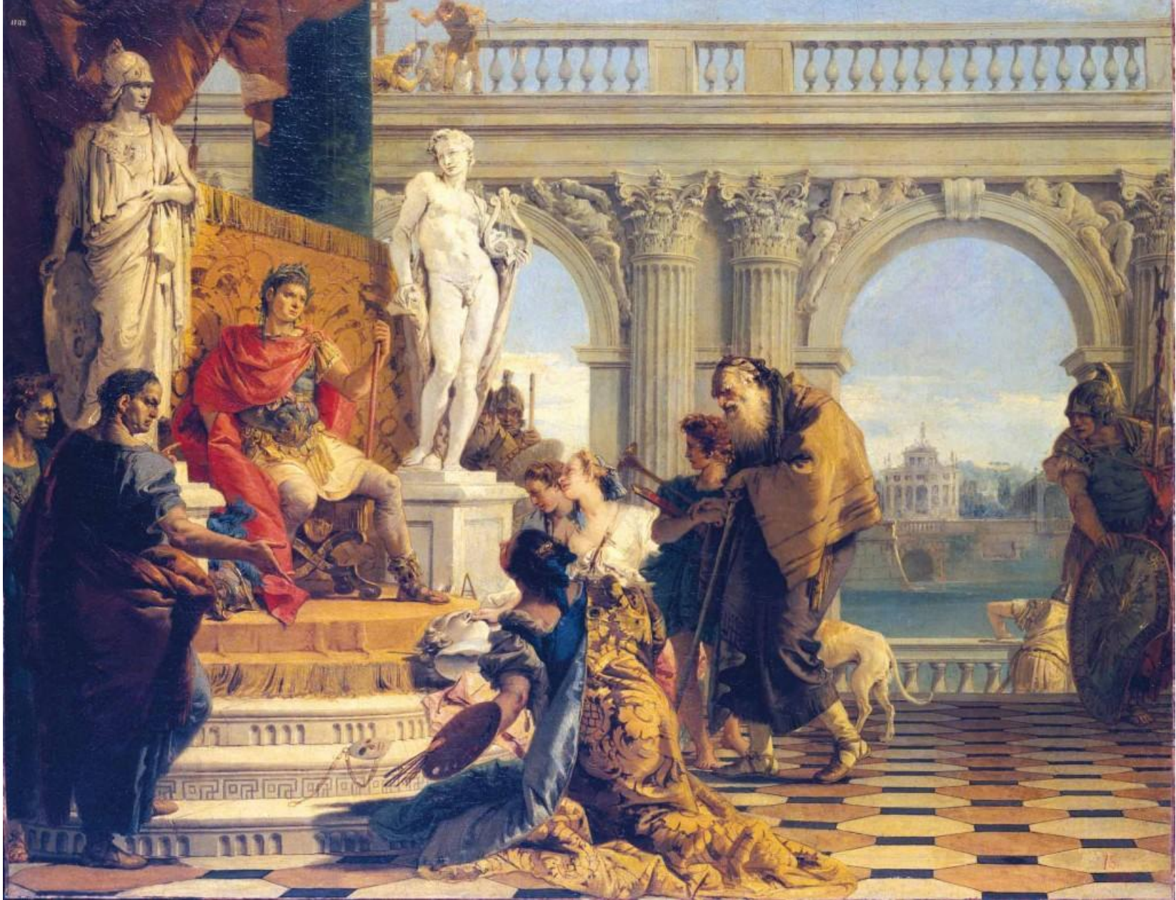
Джованни Баттиста Тьеполо (1696–1770). «Меценат представляет императору Августу свободные искусства». (ГЭ). Позднее барокко.