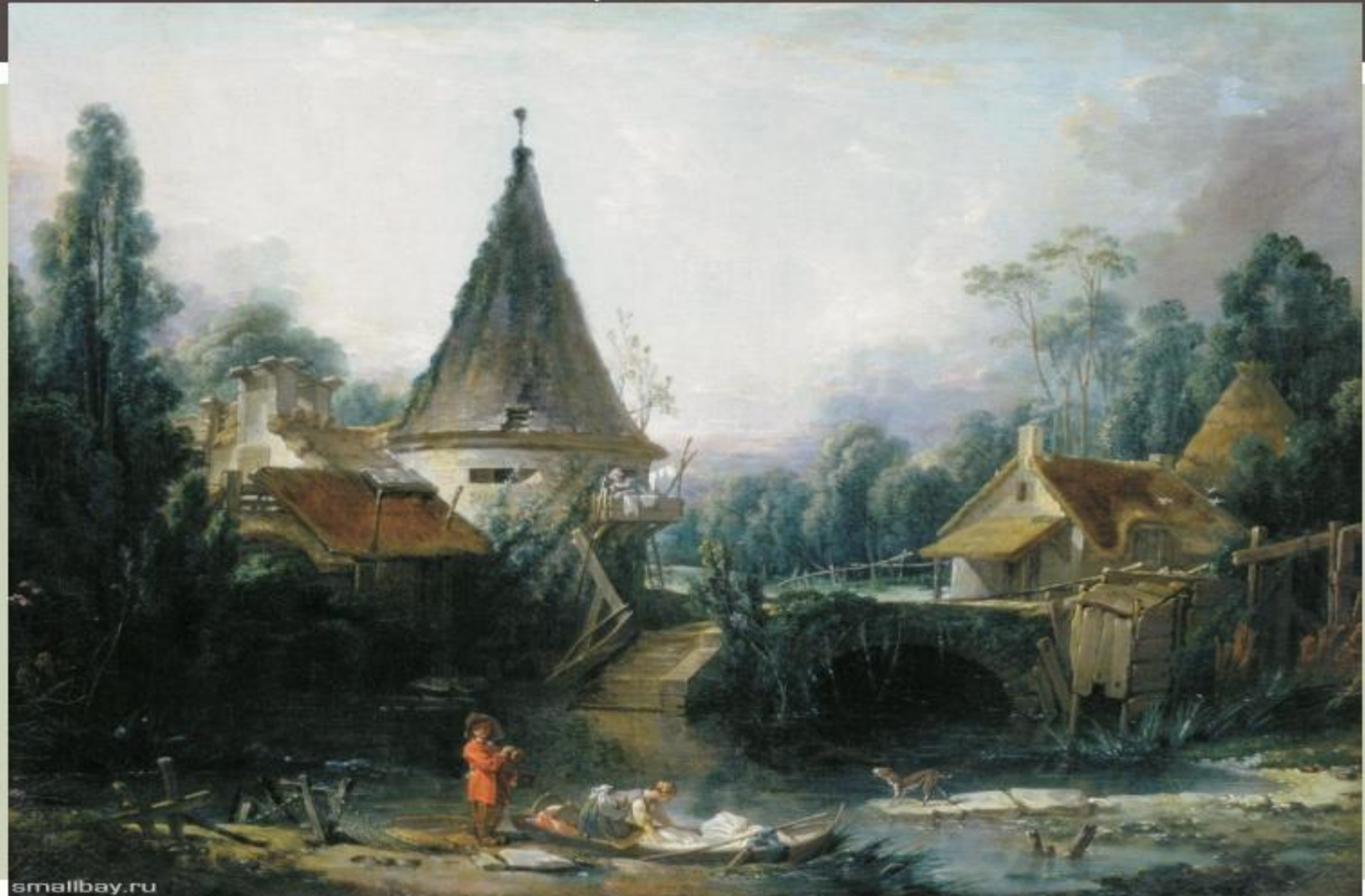
Франсуа Буше (1703–1770). «Пейзаж в окрестностях Бове». 1742 г. (ГЭ). Рококо.