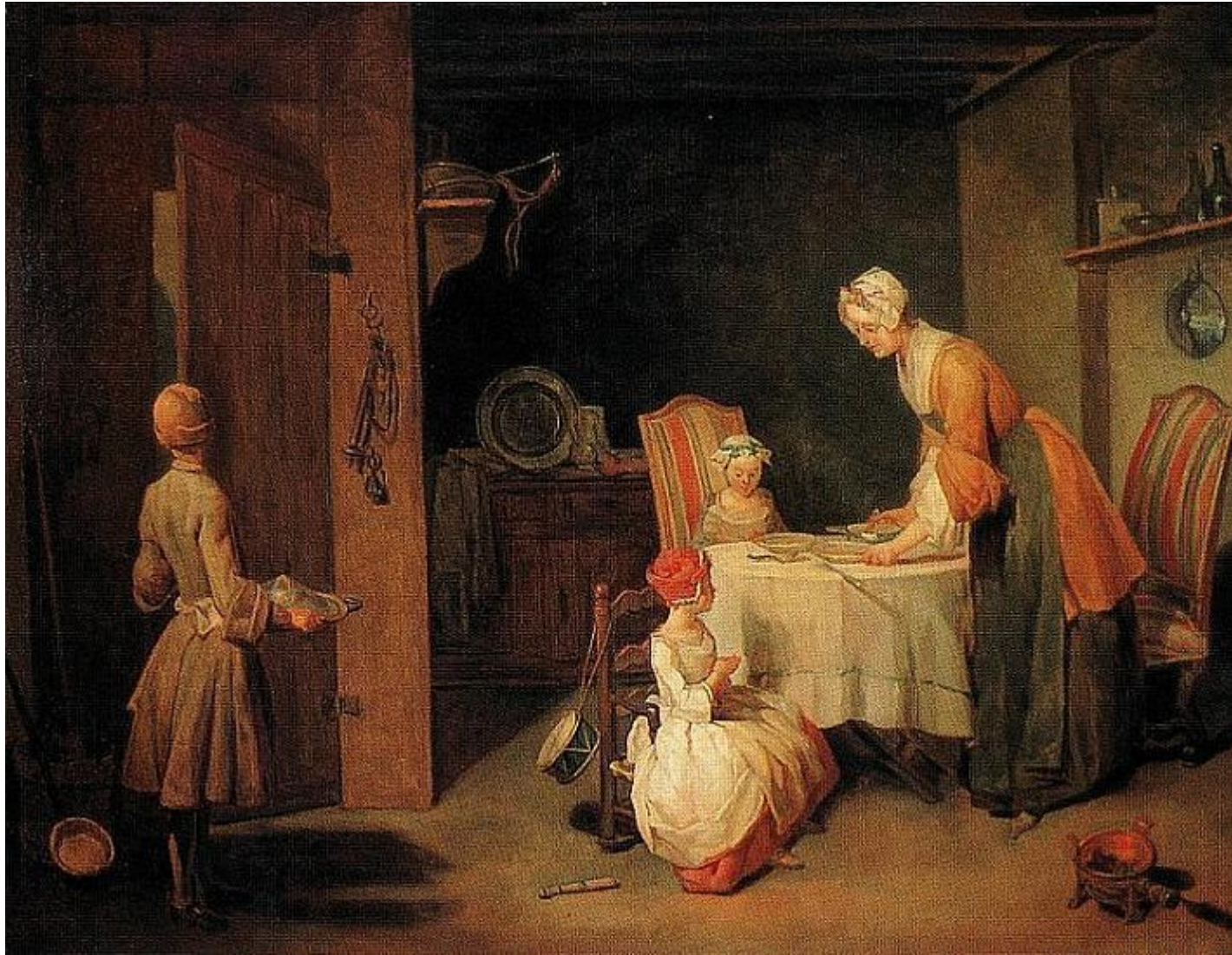
Ж.Б.С.Шарден. «Молитва перед обедом».1744 г. (ГЭ). Реализм