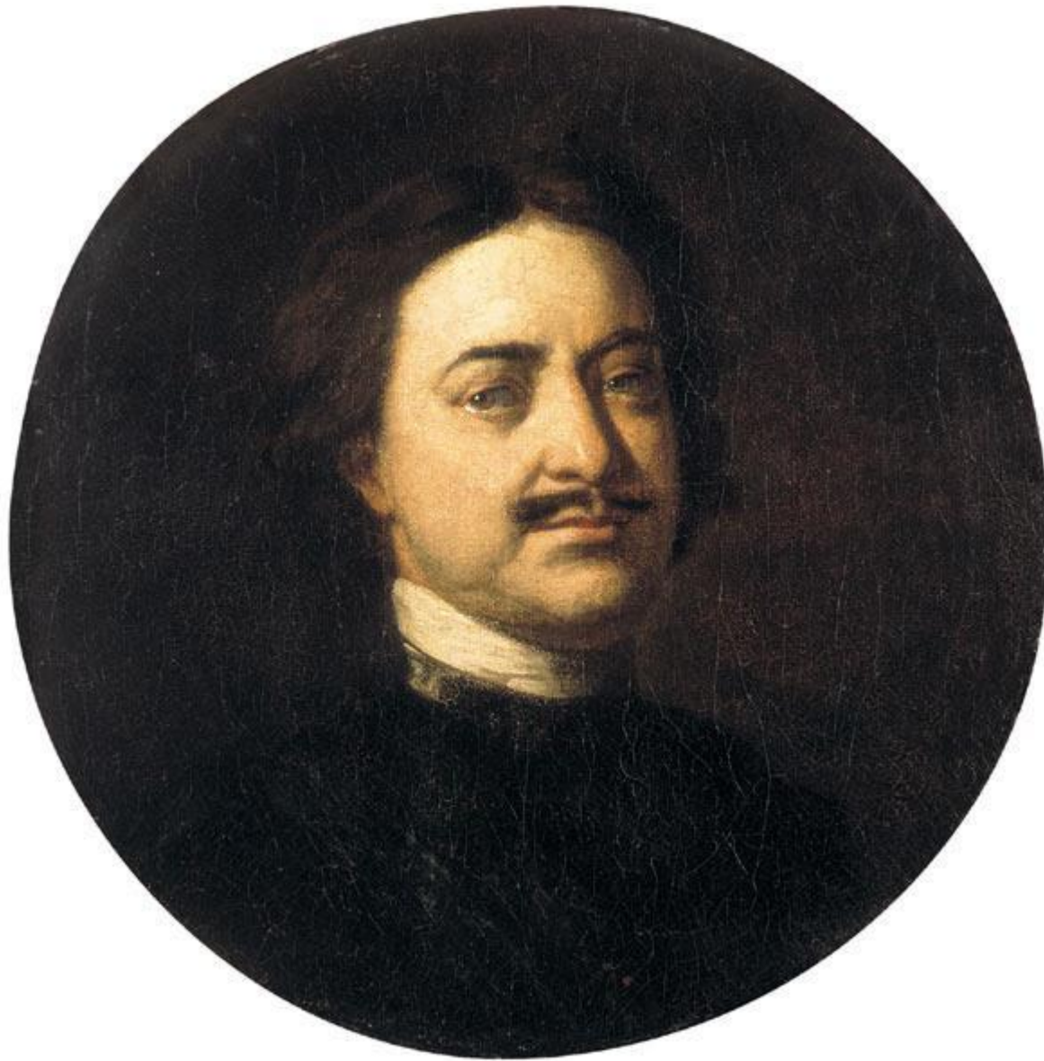
И.Н.Никитин. «Портрет Петра I в круге». Начало 1720-х гг. Реализм.