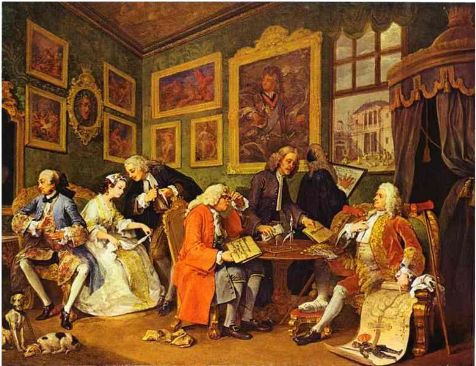
Уильям Хогарт (1697–1764). «Модный брак». 1743 г. Реализм. Брачный контракт