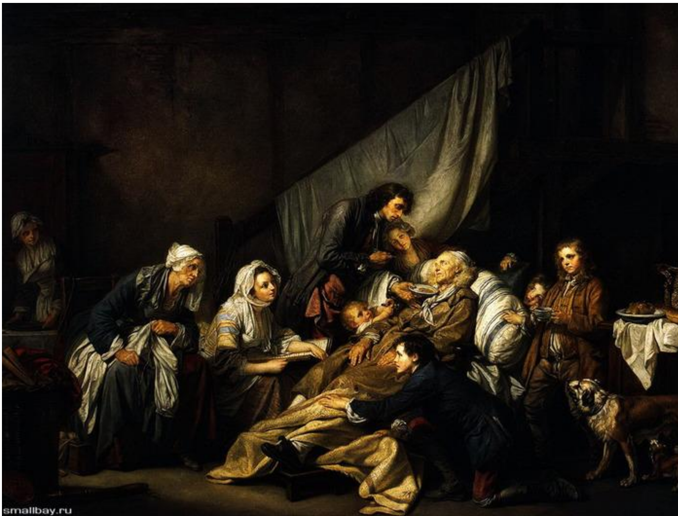
Жан Батист Грез (1725–1805). «Паралитик, или Плоды хорошего воспитания». 1763 г. (ГЭ). Сентиментализм.