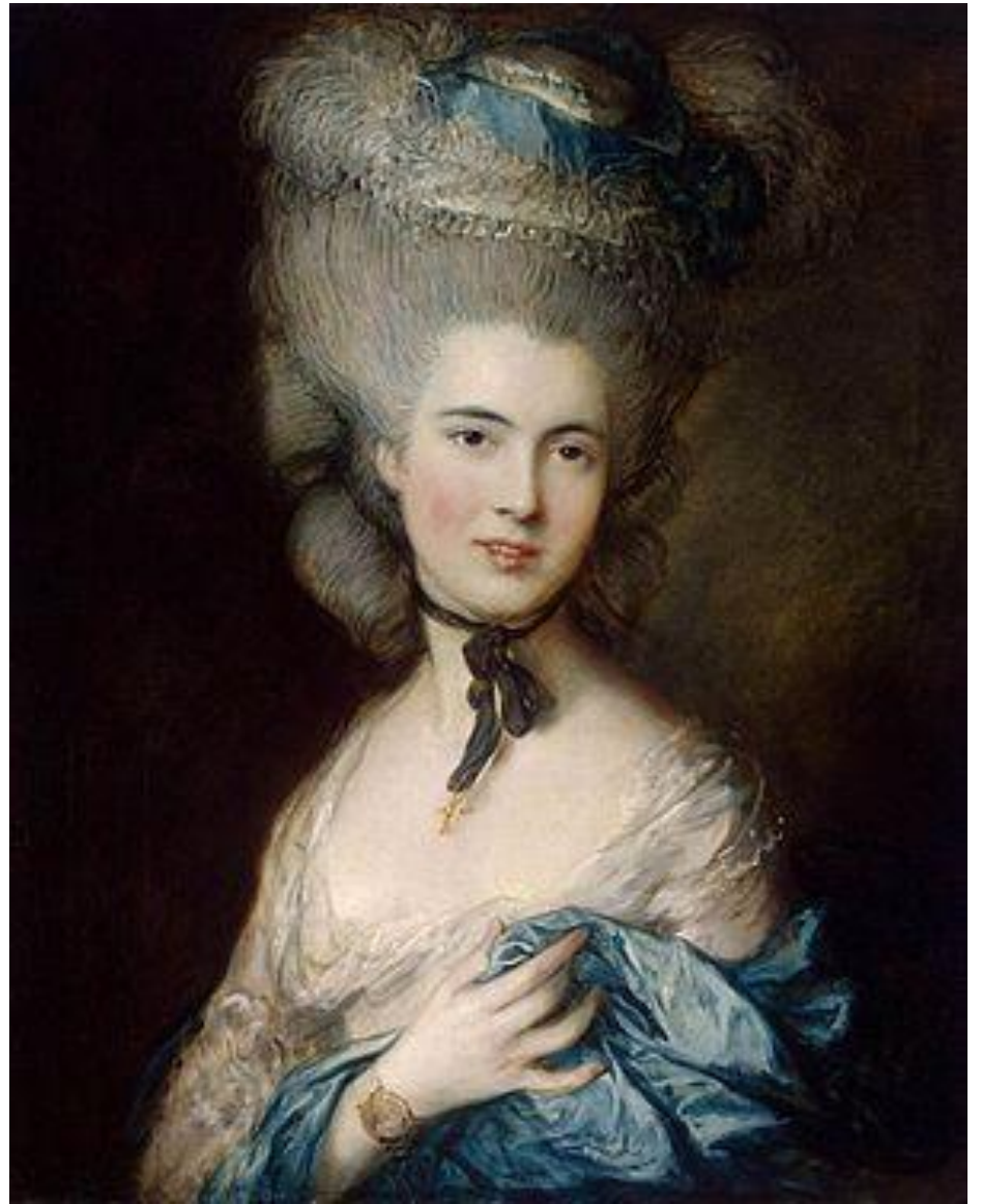
Т.Гейнсборо. «Портрет дамы в голубом». 1770-е гг. (ГЭ). Сентиментализм.