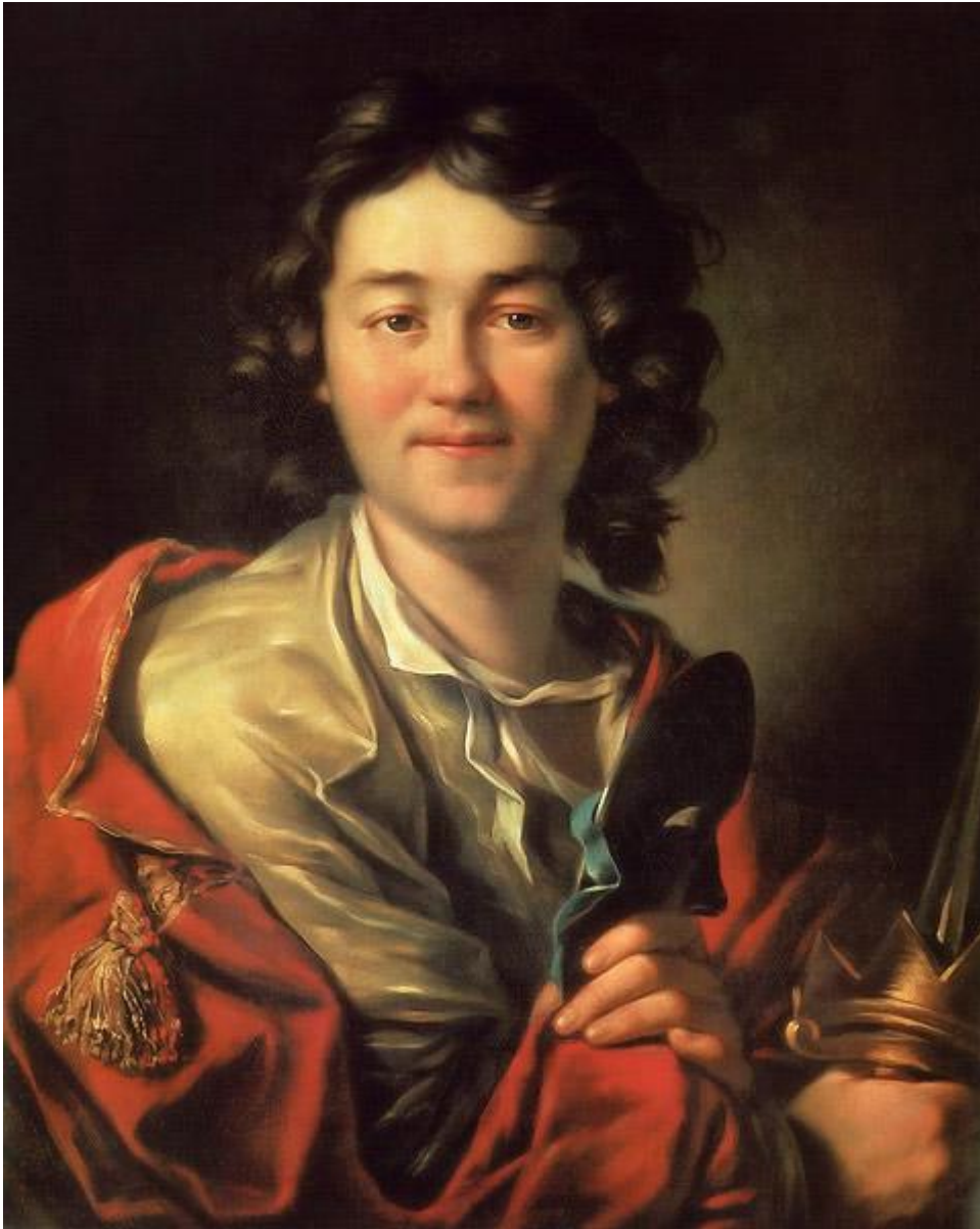
Антон Павлович Лосенко (1737–1779). «Портрет актера Ф.Г.Волкова». 1763 г. Классицизм.