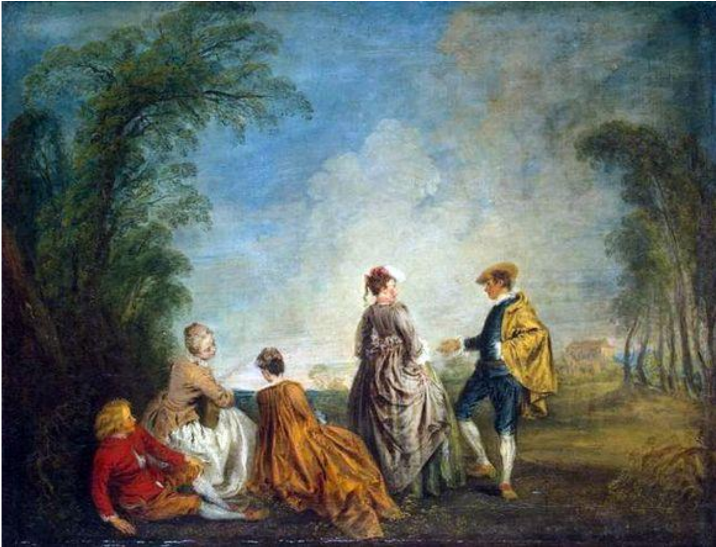
А.Ватто. «Затруднительное предложение». (ГЭ). Предтеча рококо.