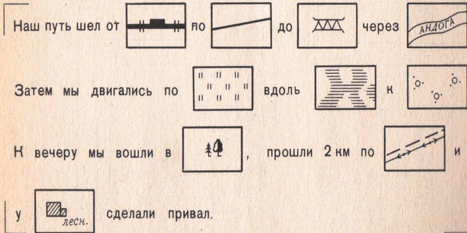
Рис. 3. Прочитайте рассказ