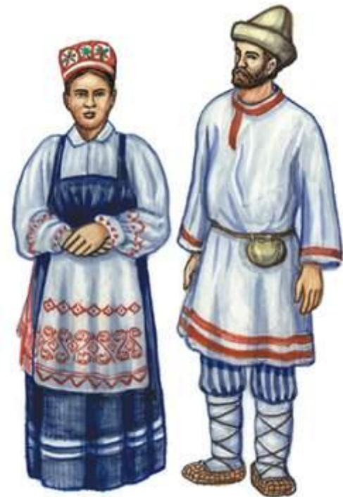
Коми - пермяки