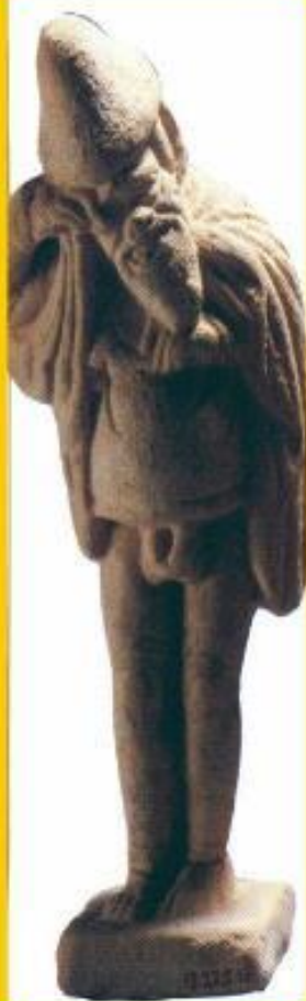
Деревянные статуи Диониса

У истоков греческого театра лежали праздники в честь бога Диониса (Вакха) , покровителя виноделия. Осенью, после уборки винограда, греки одевались в козьи шкуры и маски, изображая лесных богов-сатиров.