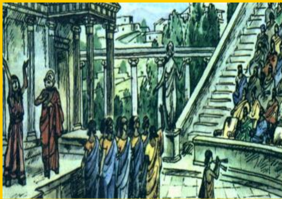
Хор на сцене.

Непременным участником представления был хор, который помогал зрителю следить за сюжетом и давал оценки поступкам героев. Хор располагался на специальной ступеньке между орхестрой и сцене, которая называлась хоры .