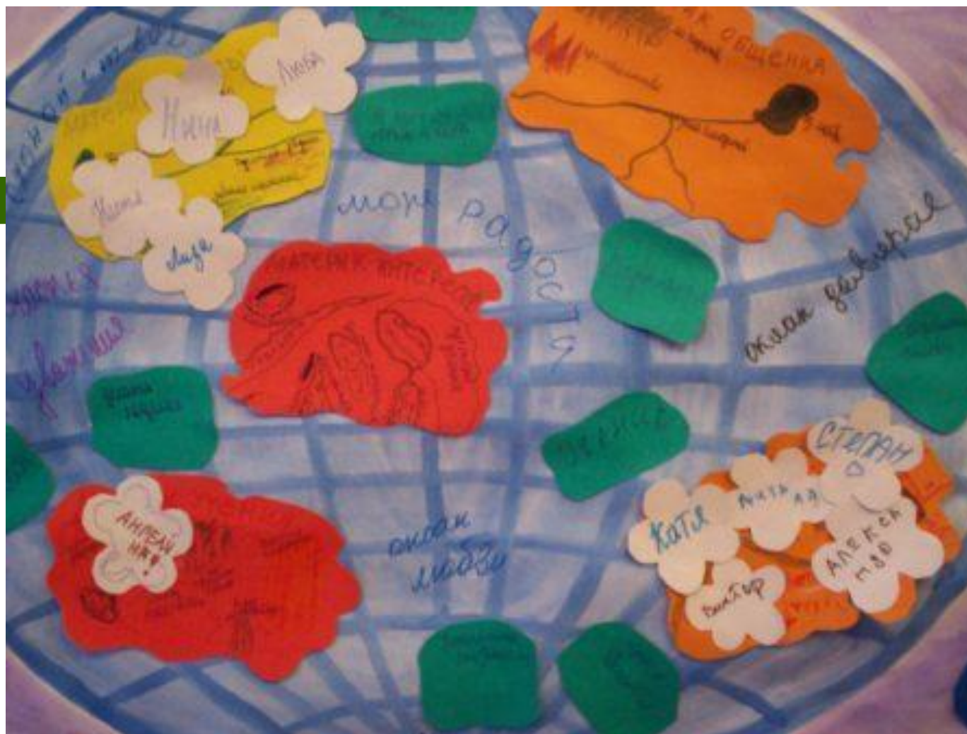
Игра «Палец вверх»