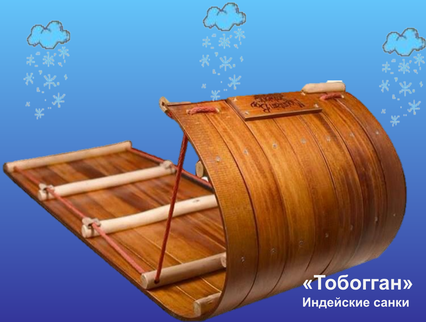
«Тобоган» Индийские санки