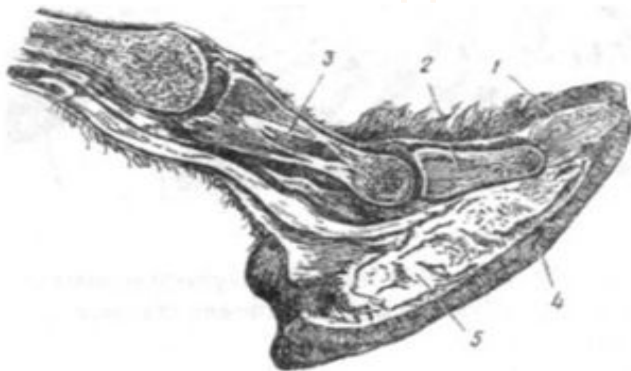
Рис. 21. Продольное сечение лапы верблюда: