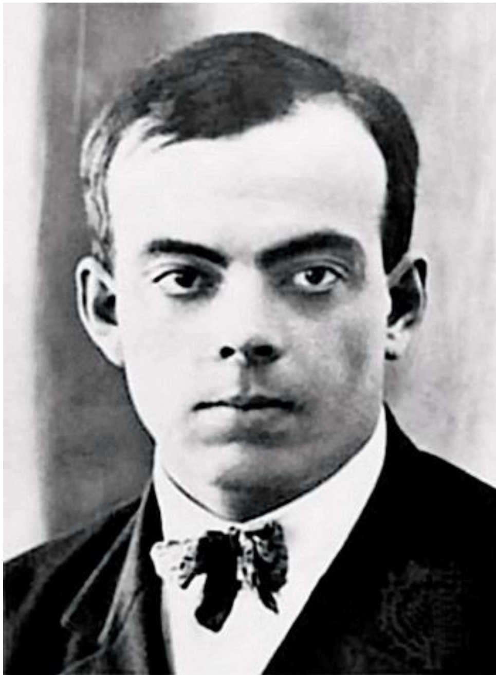
Антуан де Сент- Экзюпери