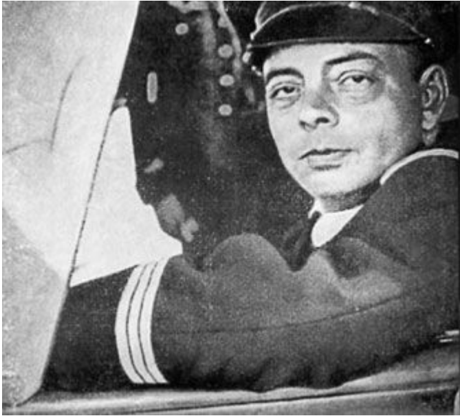
Антуан де Сент- Экзюпери.