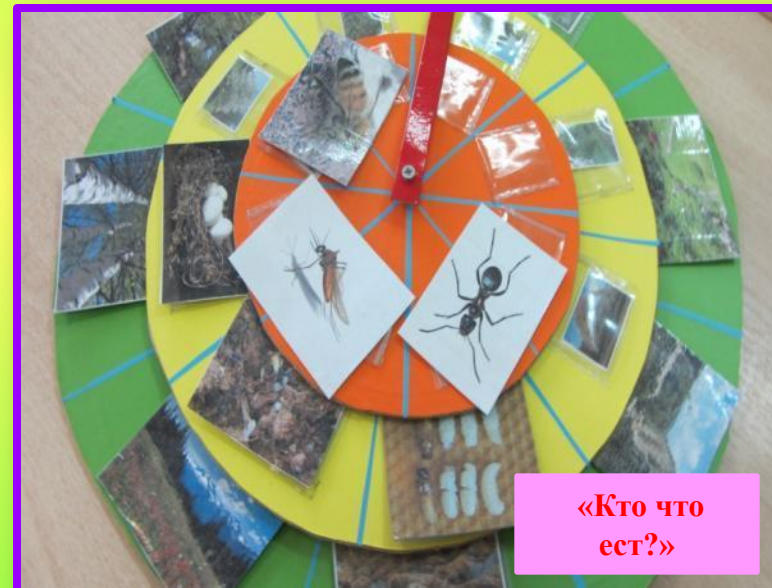
«Кто что ест?»