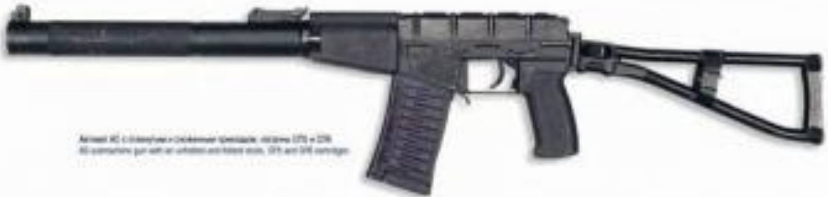
Автомат АС с отъемной и складываемой рукояткой: длина 870 и 620 мм соответственно при сложенной рукоятке; масса 2,3 кг