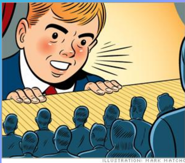
ILLUSTRATION: MARK MATCHO