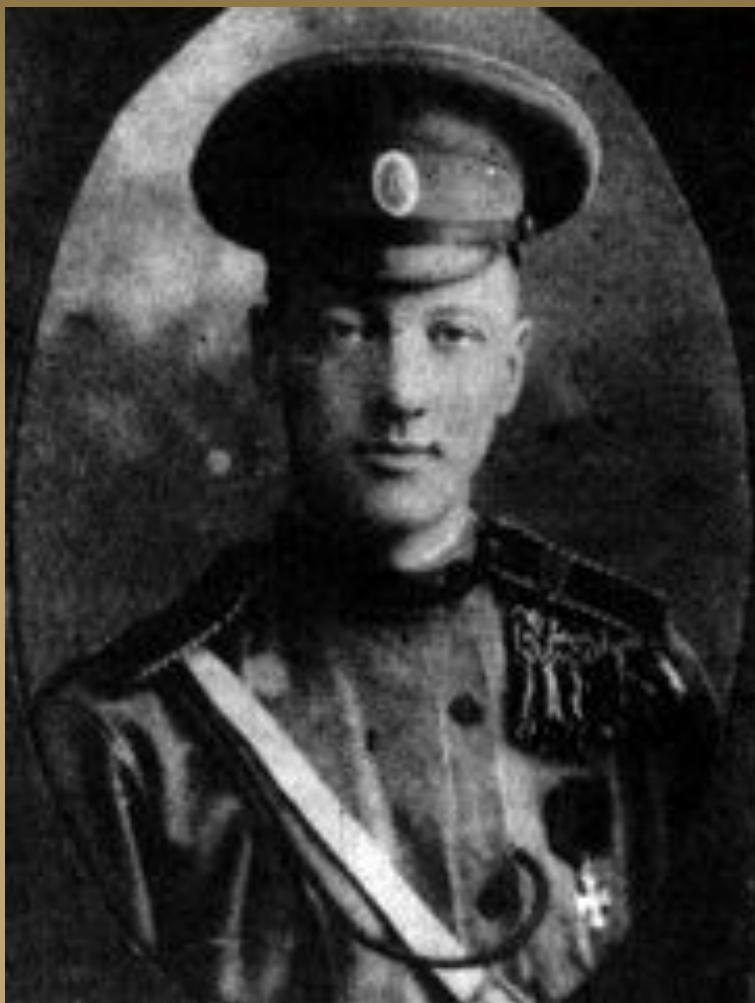
Н. Гумилёв Фотография.

Та страна, что могла быть раем, Стала логовищем огня, Мы четвертый день наступаем, Мы не ели четыре дня. И залитые кровью недели Ослепительны и легки, Надо мною рвутся шрапнели, Птиц быстрее взлетают клинки.