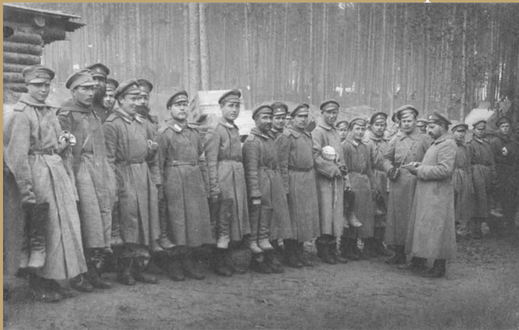
Выдача новых сапог. (фотография)

В мае Гумилёв вновь был эвакуирован в Петроград. Описанная в «Записках кавалериста» ночная скачка в жару стоила ему воспаления лёгких. Когда лечение почти закончилось, Гумилёв без спроса вышел на мороз, в результате чего болезнь вновь обострилась. Врачи рекомендовали ему лечиться на юге. Гумилёв уехал в Ялту. Однако на этом военная жизнь поэта не закончилась. 8 июля 1916 года он вновь уехал на фронт, вновь ненадолго. 17 августа приказом по полку № 240 Гумилёв был командирован в Николаевское кавалерийское училище, потом вновь переведён на фронт и оставался в окопах вплоть до января 1917 года.