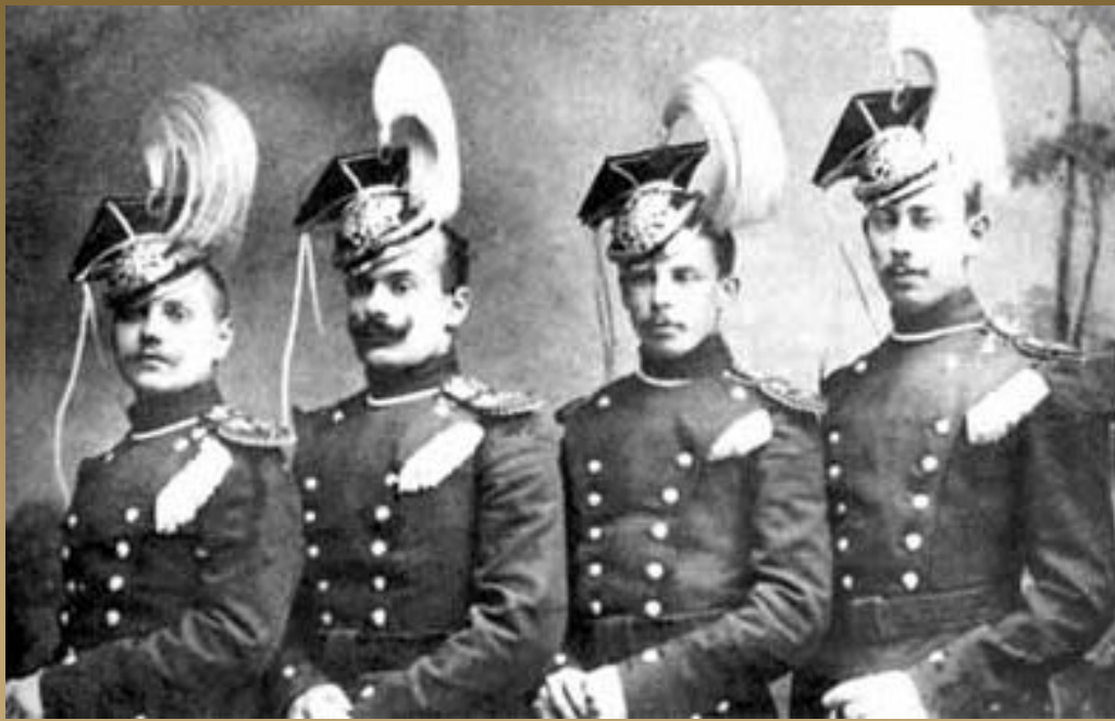
Гвардейские уланские полки

В конце февраля в результате непрерывных боевых действий и разъездов Гумилёв заболел простудой: