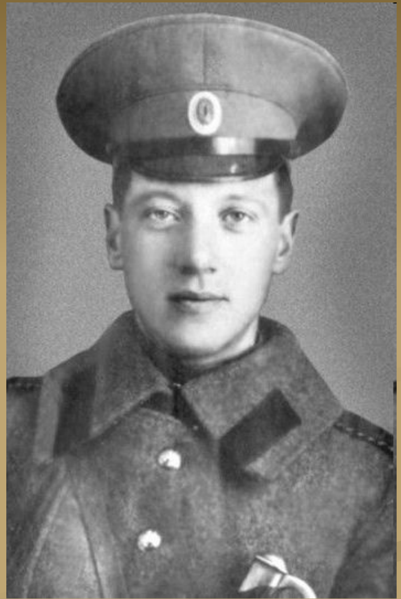
Н. Гумилёв 1914г.

В сентябре и октябре 1914 года проходили учения и подготовка. Уже в ноябре полк был переброшен в Южную Польшу. 19 ноября состоялось первое сражение. За ночную разведку перед сражением он был награждён знаком отличия военного ордена (Георгиевского креста) 4-й степени и повышен в звании до ефрейтора. Уже 15 января 1915 года он был произведён в унтер-офицеры.