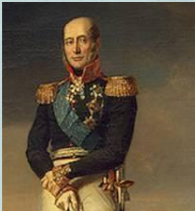
Командующий 1-ой Западной армией Барклай-де-Толли М. Б.